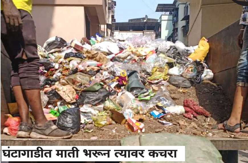
घंटागाडीत माती भरून त्यावर कचरा

पनवेल पालिका हद्दीत दरोज तयार होणाऱ्या घनकचऱ्याची वाहतूक करण्यासाठी पालिका प्रशासनाने ५४ घंटागाड्या तसेच १५ कोर्कटरची खरेदी केली आहे. या वाहनांची देखभाल आणि वाहतूक करण्यासाठी प्रशासनातर्फे नोव्हेंबर २०२३ रोजी नव्या