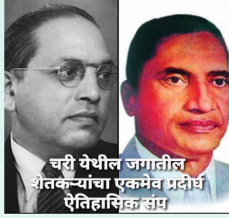
चरी येथील जगातील शेतकऱ्यांचा एकमेव प्रदीर्घ ऐतिहासिक संप

कोकणातील खोती पध्दतीमुळे शेतकऱ्यांची स्थिती