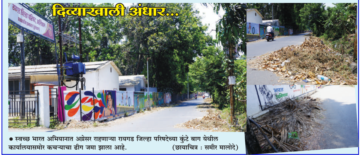
● स्वच्छ भारत अभियानात अग्रेसर राहणाऱ्या रायगड जिल्हा परिषदेच्या कुंटे बाग येथील कार्यालयासमोर कचऱ्याचा ढीग जमा झाला आहे.

घेतला. तेव्हा कुठे प्रशासनाचे डोळे उघडले. उशिरा का होईना