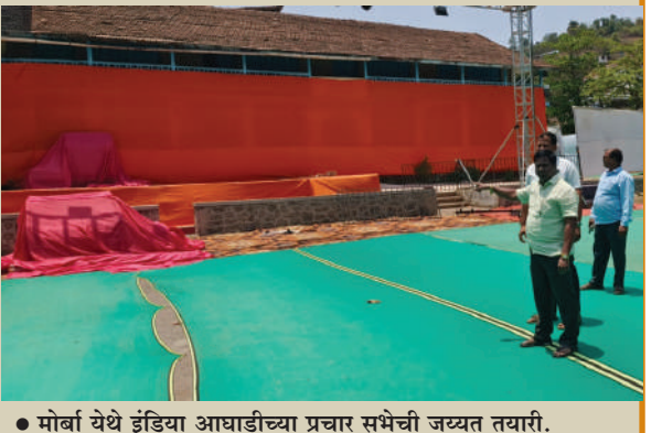
● मोर्बा येथे इंडिया आघाडीच्या प्रचार सभेची जयंत तयारी.