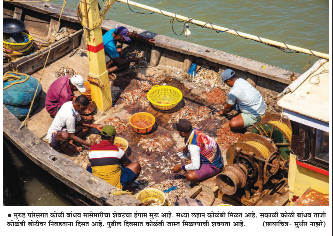
● मुरुड परिसरात कोळी बांधव मासेमारीचा शेवटचा हंगाम सुरु आहे. सध्या लहान कोळंबी मिळत आहे. सकाळी कोळी बांधव ताजी कोळंबी बोटीवर निवडताना दिसत आहे. पुढील दिवसात कोळंबी जास्त मिळण्याची शक्यता आहे.

यांच्या संयुक्त उद्यमाने या आरोग्य शिबिराचे आयोजन करण्यात आले होते. या शिबिराचा मुळ उद्देश म्हणजे रोजच्या घकाधकीच्या जीवनात सर्वसामान्या नागरिकांचे आरोग्याकडे होत असलेल्या दुर्लक्षामासून सजग करणे आणि बाहेर उपलब्ध असलेल्या वेगवेगळ्या महागड्या चाचण्यांचे नियोजन मोफत करून देणे. या शिबिरात मोफत बीपी, शुगर, ईसिजी, शरीराचे वजन आणि उंचीनुसार असावे लागणारे वजन, पल्स ऑक्सिमिटर मार्फत हृदयाच्या टोक्यांचे निदान, कॅन्सर साखळ्या रोगाचे वेगवेगळ्या चाचण्यांमार्फत निदान करण्यात आले. शिबिरात १५०हून अधिक नागरिक, विद्यार्थी, शिक्षक, शिक्षकेतर कर्मचाऱ्यांनी लाभ घेतला.