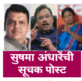
सुषमा अंधारेची सूचक पोस्ट

। मुंबई । वृत्तसंस्था । पंकजा मुंडे-महादेव जानकर यांना उमेदवारी, जळगावचा जाहिर उमेदवार, बदलण्याची तयारी, एकनाथ खडसे यांची पुन्हा अमित शाह यांच्याशी भेट, देवेंद्र फडणवीसांना भेटीसाठी दोन-दोन दिवस वाट पाहावी लागणं, पण त्याचवेळी नवनीत राणा यांना मात्र तासाभरात भेट या सगळ्यांचा अर्थ फडणवीसांना विनोद तावडेंनी चितपट केलं आहे, अशी पोस्ट सुषमा अंधारे यांनी केली आहे. या पोस्टसोबत ‘आता कधीच येणार नाही’ असा हॅशटॅगही त्यांनी दिला आहे. देवेंद्र फडणवीसांच्या ‘मी पुन्हा येईं’ या व्हायरल घोषणेवरून हा टोला लगावल्याचं बोललं जात आहे.