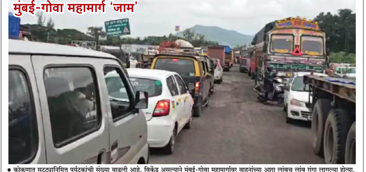
● कोकणात सुट्ट्यानिमित्त पर्यटकांची संख्या वाढली आहे, विकेंड असल्याने मुंबई-गोवा महामार्गावर वाहनांच्या अशा लांबच लांब रंगा लागल्या होत्या.