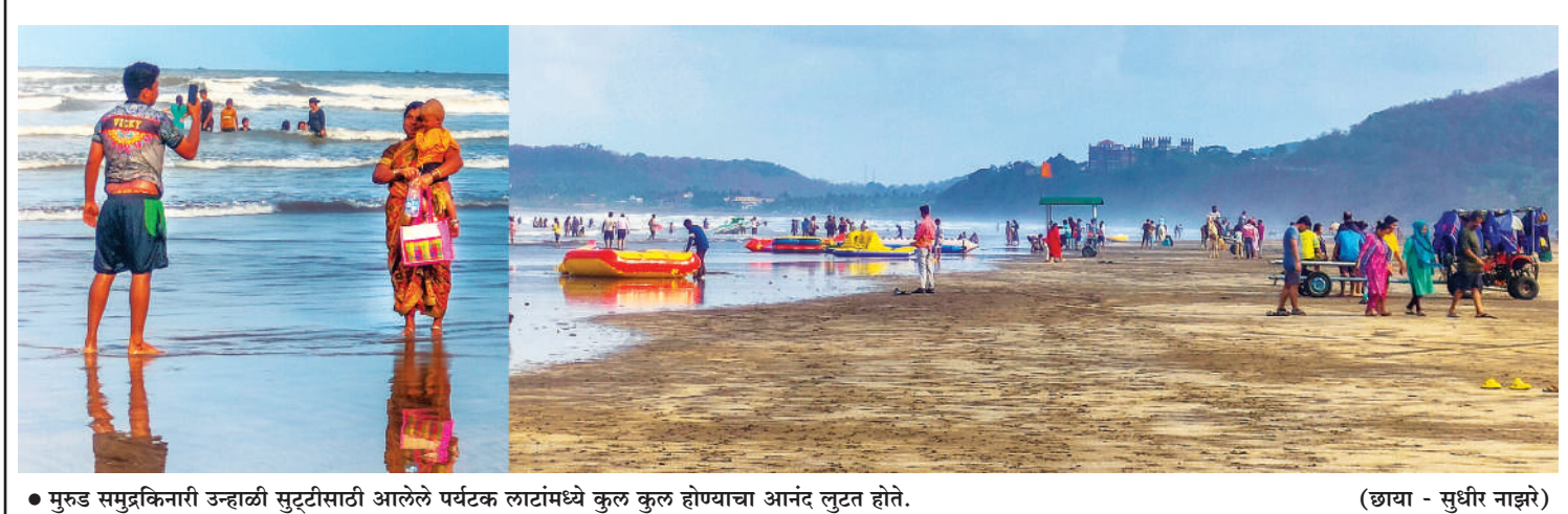
● मुरुड समुद्रकिनारी उन्हाळी सुट्टीसाठी आलेले पर्यटक लाटांमध्ये कुल कुल होण्याचा आनंद लुटत होते.

पनवेल : बिरमोले हॉस्पिटल शेजारी गणेश छाया बिल्डिंग येथे रिकन्स्ट्रक्शनचे काम चालू आहे. त्या ठिकाणी पोकेलिन खोदकाम चालू असताना जमिनीखालून जाणाऱ्या घरगुती गॅसची लाईन तुटली आणि मोठ्या प्रमाणात गॅसची गळती झाली. रविवार आणि त्यात दुपारची वेळ असल्याकारणाने पटकन लक्षात आले नाही. यावेळी मोठा आवाज आल्याने त्वरित महानगरपालिकेच्या अग्निशमन दलाला आणि महानगर गॅस अधिकाऱ्यांना फोन केले असता त्वरित येऊन त्यांनी मुख्य लाईन बंद केली. नागरिकांच्या जागृतेमुळे मोठा अनर्थ टळला.