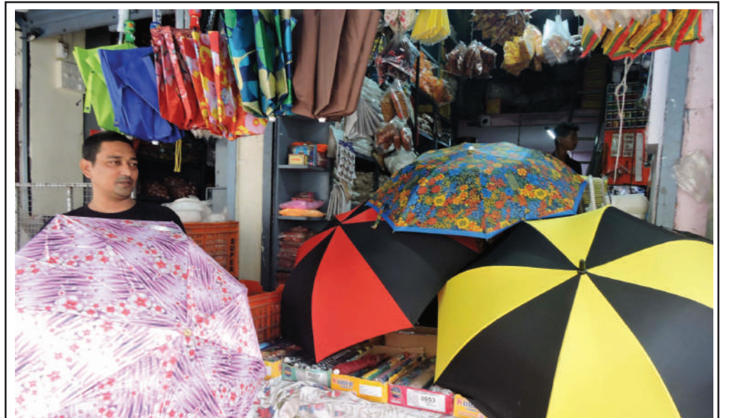
आला पावसाळा... काही दिवसांनी पावसाळा सुरूवात होणार आहे. बाजारांमध्ये विविध प्रकारच्या छाया, रेंकोट विक्रीसाठी उपलब्ध झाले आहेत.