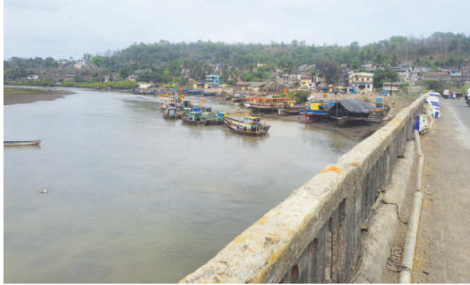
यावेळी स्थानीक कोळी बांधवांनी प्रतिक्रिया देत म्हणाले की, १ जून पूर्वी

। मुरुड-जंजिरा । वार्ताहर । महाराष्ट्र शासनाच्या आदेशानुसार पावसाळ्यात १ जून ते ३१ जुलैपर्यंत समुद्रातील मासेमारी बंद राहणार आहे. मात्र, समुद्रात २४ मे पासूनच अकस्मातपणे वादळी वातावरण निर्माण झाल्याने मुरुड परिसरातील एकदरा, राजपुरी, दिघी येथील सुरु असलेली मच्छीमारी वेळे आधीच बंद करण्यात आली आहे. तसेच, सुमारे १०० नौका किनाऱ्यावर नांगरण्यात आल्याची माहिती एकदरा गावच्या कोळी बांधवांनी सांगितले.