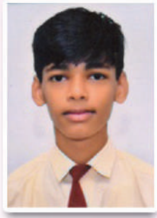
सार्थक जुईकर ९१.६०%