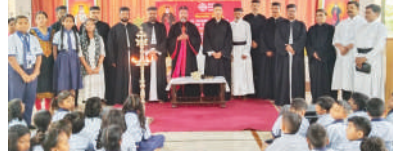
यांचा जन्म ८ मार्च रोजी निराम, केरळ येथे झाला होता. त्यांनी