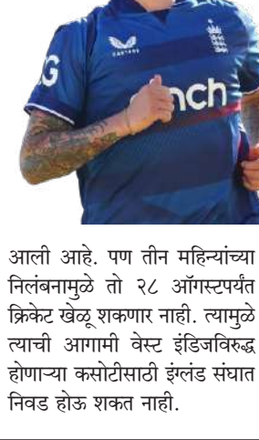
आली आहे. पण तीन महिन्यांच्या निलंबनामुळे तो २८ ऑगस्टपर्यंत क्रिकेट खेळू शकणार नाही. त्यामुळे त्याची आगामी वेस्ट इंडिजविरुद्ध होणाऱ्या कसोटीसाठी इंग्लंड संघात निवड होऊ शकत नाही.

कासॅने हे आरोप मान्य केले आहेत आणि चौकशीसाठीही सहकार्य केले. त्याने २०१७ ते २०१९ दरम्यान वेगवेगळ्या सामन्यांवर ३०३ वेळा सट्टा लावला होता. एका वृत्तानुसार त्याने तो खेळत असलेल्या सामन्यांवर सट्टा लावला नाही, पण त्याने त्याचा देशांतर्गत संघ इरहम च्या सामन्यांवर पैसे लावले होते. मिळालेल्या माहितीनुसार, सर्व गोष्टी लक्षात घेतल्यानंतर त्याच्यावर १६ महिन्यांची बंदी घालण्यात आली होती, ज्यातील १३ महिन्यांवर स्थगिती देण्यात