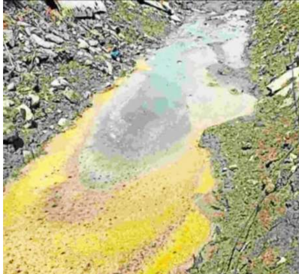
किमान १० टँकर स्वच्छ केले जातात, असे महाराष्ट्र स्मॉल स्केल

रसायनमिश्रित पाण्यामुळे जेएनपीए बंदर परिसरात अनेक ठिकाणी असलेल्या अनधिकृत सॉल्व्हेंट स्टोर्स मध्ये मोठ्या प्रमाणात रसायनांचे टँकर धुण्यात येत आहेत. मात्र, पर्यावरणाला हानीकारक असलेल्या या कृत्याकडे संबंधित अधिकारी वर्ग जाणूनबुजून दुर्लक्ष करीत असल्याचे दिसत आहे. याबाबत पर्यावरण प्रेमी आणि मच्छीमारांनी टँकर धुतल्यानंतर बाहेर फेकल्या जाणाऱ्या रसायनमिश्रित पाण्यामुळे मासे मरत असल्याची तक्रार थेट मुख्यमंत्री एकनाथ शिंदे यांच्याकडे केली आहे. जेएनपीए कंटेनर प्रेट स्टेशनजवळील सोनारी येथील अशाच एका सेवा केंद्रात दरोज