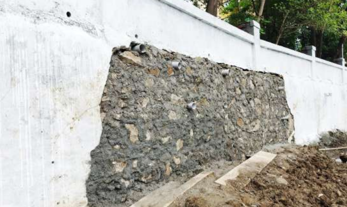
त्या भगदाडाबद्दल माहिती मिळाल्यानंतर जिल्हा परिषद बांधकाम विभागाचे उप

सुशोभीकरण आणि मजबूतीकरण केले जात आहे. त्या माध्यमातून तलावातील पाण्याच्या तळाशी असलेल्या भिंतीला प्लास्टर तसेच तलावाच्या पाण्याच्या वरच्या भागात संरक्षण भित व अन्य कामे सुरु आहेत. २० जून रोजी नेरळ परिसरात साधारण दोन तास पाऊस पडला आणि त्या पावसात तलावातील भिंतीचे प्लास्टर कोसळले. सोबत तलावाच्या भिंतीला मोठे भगदाड पडले. या भगदाडमुळे नेरळ ग्रामपंचायतचे मालकीच्या राजमाता जिजामाता तलावाच्या सुशोभीकरण कामावर प्रश्नचिन्ह निर्माण झाले होते. साधारण दोन कोटी खर्चून राजमाता जिजामाता तलावाचे सुशोभीकरण केले जात आहेत.