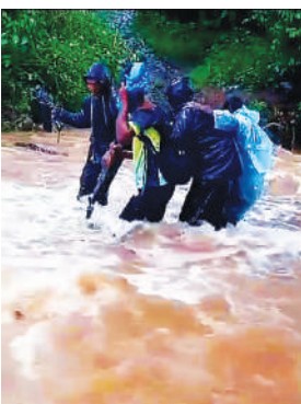
वाडीमध्ये जाण्यासाठी एक मोठा नाला पार करावा लागतो. गुरुवारी सकाळी तेथील काही रहिवासी

ठाणे जिल्ह्यातील वांगणी येथून जावे लागत असलेली वाघिणीचे वाडी ही दुर्गम भागात वसली आहे. या वाडीमध्ये जाण्यासाठी साधारण दोन किलोमीटर अंतराची पायवाट असून, वन विभागाची जमीन असल्याने त्या ठिकाणी जाण्यासाठी रस्ता बनविता आलेला नाही. त्यात बेडीसगाव येथून वाघिणीचे