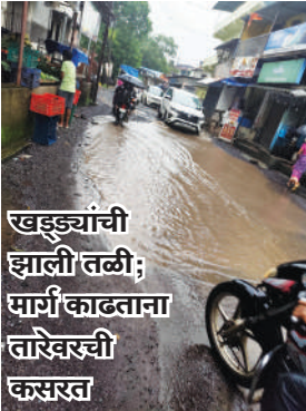
खड्ड्यांची झाली तळी; मार्ग काढताना तारेवरची कसरत

बल्लाळेश्वर मंदिराकडे जाणाऱ्या रस्त्याची दुरुवस्था झाली आहे. या रस्त्यावर टिकठिकाणी खडे पडले आहेत. नगरपंचायतीतर्फे तात्पुरती उपाययोजना म्हणून खडी टाकण्यात आली होती. मात्र, ही खडी बाहेर येऊन पुन्हा खडे पडले असून, पावसाचे पाणी साठून त्यांना तळ्याचे स्वरूप प्राप्त झाले आहे. परिणामी मार्ग काढताना तारेवरची कसरत करावी लागत आहे.