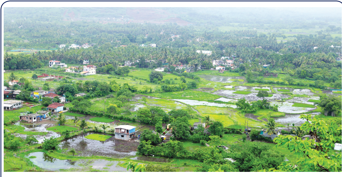
मुळूड तालुक्यातील सुरई दत्त टेकडीवरून आजूबाजूच्या बोर्ली, कानु वाडी व बाशींवा या गावांचे हिरवेगार असे नयनरम्य दृश्य.

। माणगाव । प्रतिनिधी । माणगाव तालुका कुणबी भवन समाज साले गुणमधील इयत्ता दहावी व बारावीत ६०% पेक्षा जास्त गुण प्राप्त विद्यार्थ्यांचा गुणगौरव सोहळा रविवारी (दि.१४) सकाळी ११.३० वाजता माणगावातील कुणबी भवन येथे आयोजित केला आहे. तरी गुणमधील सर्व गावातील दहावी व बारावीच्या विद्यार्थ्यांनी आपली गुणपत्रिकेची प्रत कुणबी भवन येथे रिविंद अर्बन ९३७३३४३४१६ यांच्याकडे जमा करावी, असे आवाहन करण्यात आले आहे.