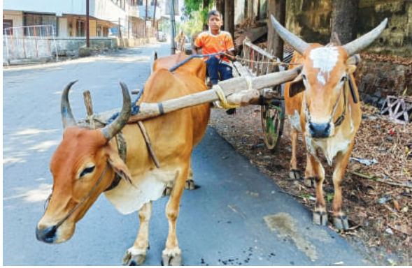
येथे वेगळा थाट आहे यांत्रिकीकरणच्या युगातही

। पाली/बेणसे । वार्ताहर । पोळा किंवा बैलपोळा हा श्रावण अमावस्या किंवा भाद्रपद अमावस्या किंवा श्रावण अमावस्या या तिथीला प्रदेशानुसार साजरा करण्यात येणारा बैलांचा सण आहे. बैलांप्रती कृतज्ञता व्यक्त करणारा हा एक मराठी सण असून हा विशेषतः विदर्भात भव्य पातळीवर साजरा केला जातो. जिल्ह्यात देखील काही शेतकरी या सणाला विशेष महत्त्व देतात. बैलांना गोंडधोड खाऊ देतात. व सजवतात देखील करतात. शर्यतीच्या बैलांचादेखील