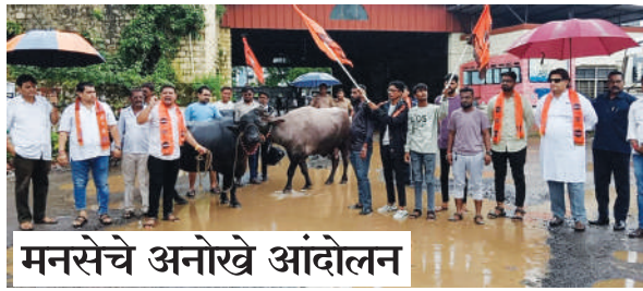
मनसेचे अनोखे आंदोलन

महाड एस्प्रीट आगाराची गेली अनेक वर्षांपासून दयनीय अवस्था आहे. त्याचप्रमाणे बांधण्यात येणारी नवीन इमारतदेखील गेले काही वर्षांपासून निधीअभावी रखडलेली आहे. जुन्या बसस्थानकातील रस्त्यावर चिखल पडल्याकडे साप्तांग्य पसरले असून, त्यामुळे प्रवाशांची मोठी गैरसोय होत आहे. त्याचप्रमाणे महिला व पुरुष प्रवाहनाहू गेले कित्येक वर्षे दुर्गंधीयुक्त घोरगंधा अवस्थेत असल्याने प्रामुख्याने महिला