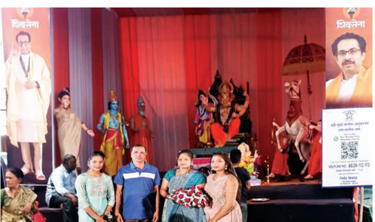
● श्री. प्रशांत राजत किहीम यांचे इथली श्री गणारायाची भव्य सजावट.