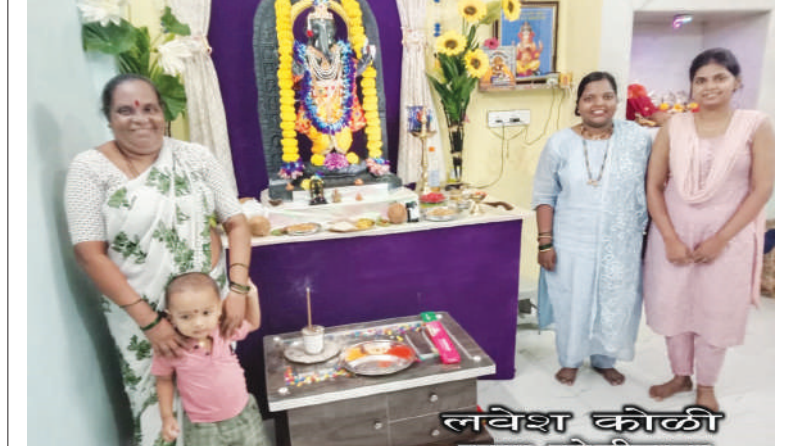
जवेश कीळी रुग्ण कौळीवाडा छाया मोहन माळी