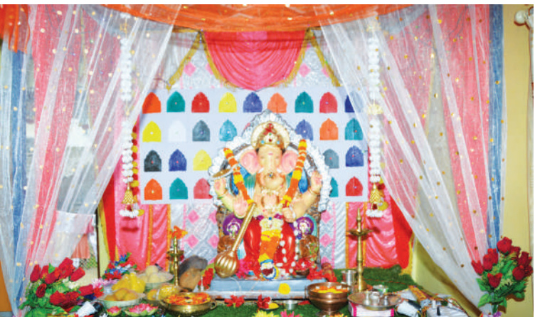
● श्री. प्रशांत राजत किहीम यांचे इथली श्री गणारायाची भव्य सजावट.