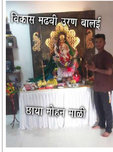
विकास मढवी उरण बालई