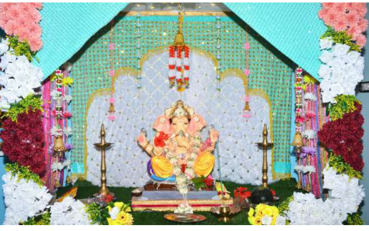
● कातळपाडा येथील राजनभाई नावेंकर यांचे निवासस्थानी श्री गणेशाची मनमोहक सजावट.