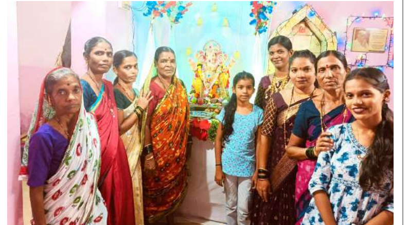
● श्रीवर्धन गाणी येथील प्रणेश रहाटबळ यांचे निवासस्थानी विराजमान श्री गणराज.