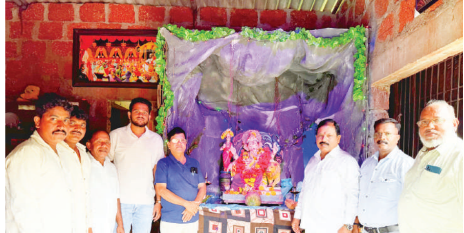
● श्री रवि जाधव सोगाव, ता. अलिबाग यांच्या निवासस्थानी विराजमान श्री गणेशाची विलोभनीय मूर्ती.