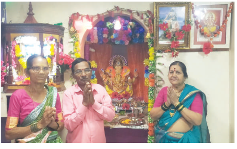
● ज्येष्ठ कार्यकर्ते शेकाप तथा माजी सदस्य ग्रामपंचायत न्हावे गोविंद भायतांडेल मु. न्हावे रोहा यांच्या निवासस्थानी विराजमान गणेशमूर्ती.