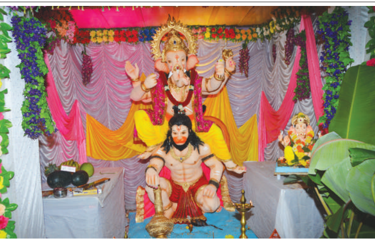
● प्रसिद्ध सूत्रसंचालन श्री. संजय मनोहर पोईलकर, सहाण यांचे इथली श्री गणेशाची भव्य सजावट.