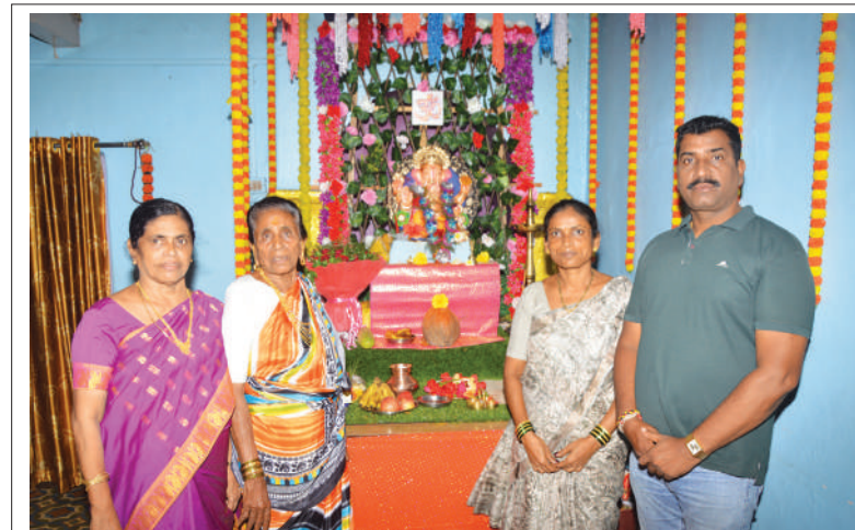
● आदर्श शिक्षक देवानंद गोगर यांचे निवासी श्री गणेशाची सजावट.