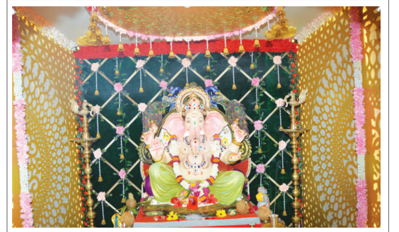
कु. स्वर अभिजित पाटील, रामनाथ अलिबाग यांचे इथली श्री गणरायाची आकर्षक सजावट.