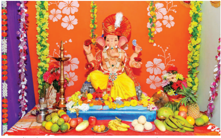
● मुरुड-डोंगरी येथील पचाक्षरी नाईक यांच्याघरची विराजमान श्री गणेशमुर्ती.