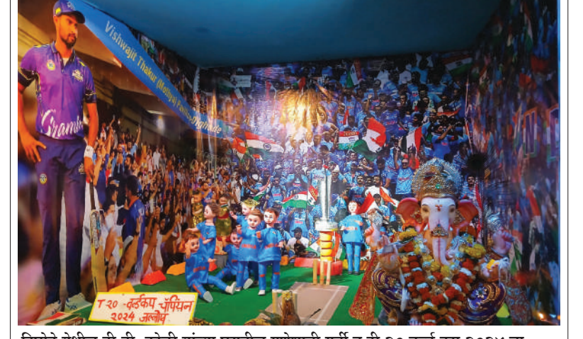
दिव्योडे येथील डी.डी. कोळी यांच्या घरातील गणेशाची मूर्ती व टी २० वर्ल्ड कप २०२४ चा देखावा.