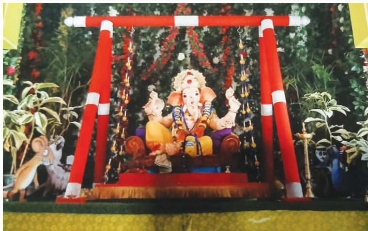
● संकेत साईनाथ घरत, साईनाथ घरत, संतोष घरत, थळपालथी अलिबाग. (सजावट : बागेमध्ये पाळणा, पर्यावरण स्नेही)