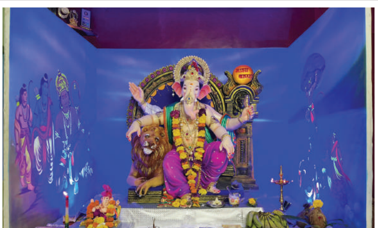
श्री. सुमित संतोष म्हात्रे, रांजणखार-विंचवली यांच्या निवासस्थानी बसलेले गणपती बाप्पा.