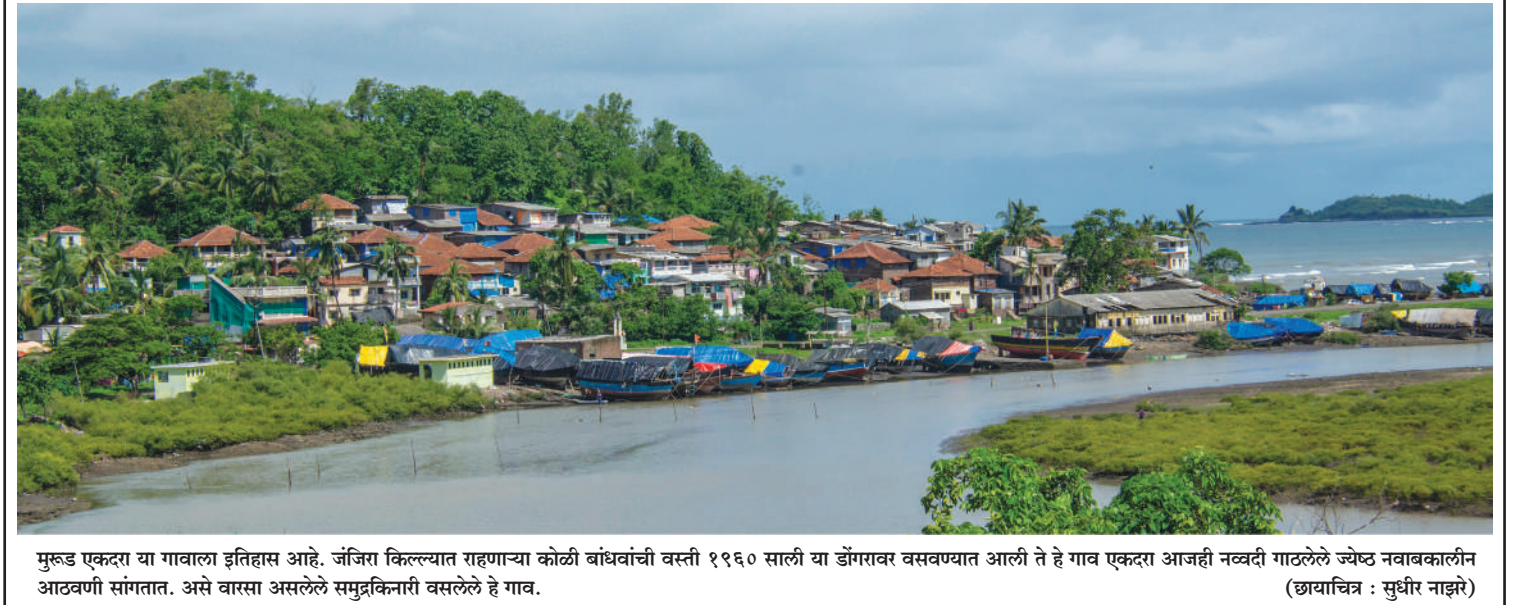
मुरुड एकदरा या गावाला इतिहास आहे. जंजिरा किल्ल्यात राहणाऱ्या कोळी बांधवांची वस्ती १९६० साली या डोंगरावर वसवण्यात आली ते हे गाव एकदरा आजही नव्वदी गाठलेले ज्येष्ठ नवाबकालीन आठवणी सांगतात. असे वारसा असलेले समुद्रकिनाऱी वसलेले हे गाव.