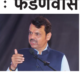
प्रतिपादन उपमुख्यमंत्री देवेंद्र फडणवीस यांनी केले.

रायगड जिल्ह्यातील करंजा येथे एक हजार मच्छिमार बोटी क्षमतेचे बंदर उभारण्याचा कामाला गती देण्यात येणार असून, त्यासाठी १५३ कोटींचा निधी उपलब्ध करून देण्यात येणार आहे. याशिवाय याठिकाणी अत्याधुनिक अशी जेटी तयार करण्यात येणार असून, हे बंदर देशातील सर्वात मोठे फिशिंग हार्बर म्हणून विकसित करण्यासाठी राज्य शासन प्रयत्नशील असल्याचे