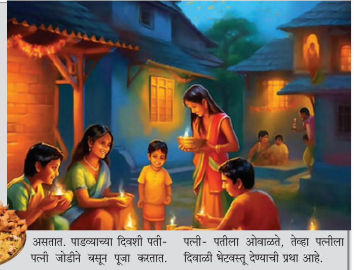
असतात. पाडव्याच्या दिवशी पती-पत्नी-पतीला ओवाळते, तेव्हा पत्नीला पत्नी जोडीने बसून पूजा करतात. दिवाळी भेटवस्तू देण्याची प्रथा आहे.

परिवारात वाटून आनंद द्विगुणित केला जातो. लक्ष्मीपूजाच्या दिवशी मातीच्या कुंड्या विकत आणल्या जातात. त्या घरी बनवून त्यात बत्ताशे टाकतात. त्यावर दिवा लावला जातो. याची शेतकरी मनोभावे पूजा करतात. घरातील माल्यावर वस्तू, वाहन, अवजारे यांचीही पूजा केली जाते. या दिवशी मोठ्या प्रमाणावर आतषबाजी केली जाते. शाळकरी मुले ही किल्ला बनवण्यात व्यस्त