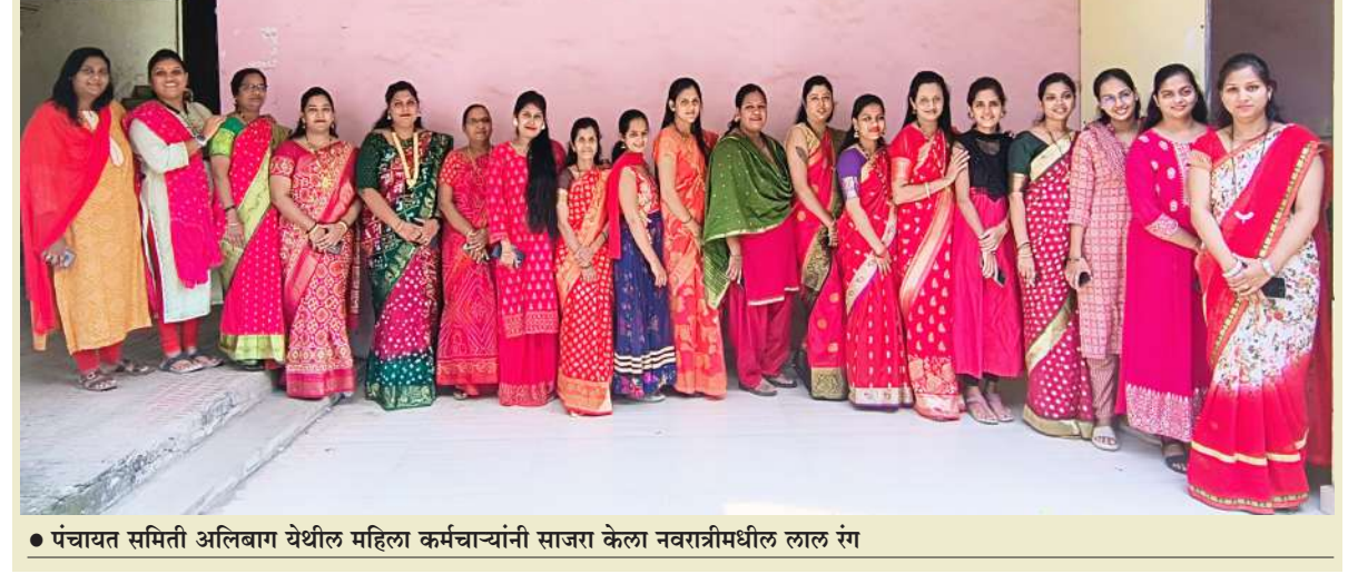
● पंचायत समिती अलिबाग येथील महिला कर्मचाऱ्यांनी साजरा केला नवरात्रीमधील लाल रंग