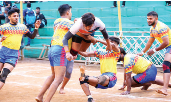
पहिल्या डावात २४-०८ अशी भक्कम आघाडी घेणाऱ्या नवोदितने दुसऱ्या डावात सावध खेळ करीत आपला विजय साकारला. अथर्व,

नवोदित संघ, शिवमुद्रा प्रतिष्ठान यांनी शिवनेरी सेवा मंडळाने आयोजित केलेल्या कुमार गट कबड्डी स्पर्धेच्या अंतिम फेरीत धडक दिली. विशेष व्यावसायिक गटात गतविजेत्या भारत पेट्रोलियम सह इन्शोअर कोट, यू इंडिया एन्सो, रिझर्व्ह बँक यांनी उपांत्य फेरी गाठली. दादर(पूर्व) शिंदेवाडी येथील भवानीमाता क्रीडांगणावर सुरू असलेल्या कुमार गटाच्या उपांत्य सामन्यात नवोदित संघाने काळाचौकीच्या अमर मंडळाला ४३-२६ असे सहज नमविले.