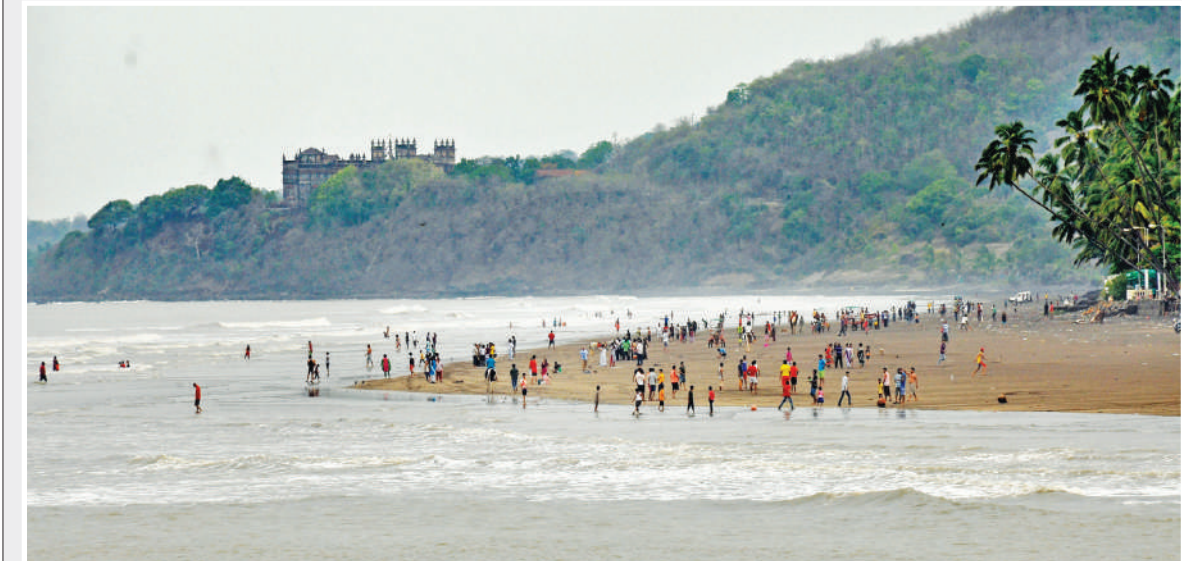
● सलगच्या सुट्ट्यांमुळे मुरुड समुद्रकिनारी पर्यटक दिसू लागले असून कडक उन्हात लाटांचा आनंद घेत आहेत.