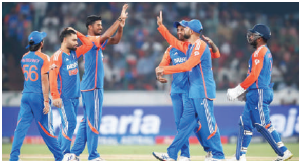
आहेत. त्यामुळे भारताने एका वर्षात सर्वाधिक सामने जिंकण्याच्या

भारतीय संघाने तिसऱ्या टी-२० सामन्यात बांगलादेशचा १३३ धावांनी पराभव केला. यासह टीम इंडियाने मालिकेत ३-० असा क्लीन स्वीप केला. या विजयाच्या जोरावर भारताने पाकिस्तानचा मोठा विक्रम म डेडिट काढला आहे. भारताने वर्ष २०२४ मध्ये आतापर्यंत एकूण २१ टी-२० आंतरराष्ट्रीय सामने जिंकले