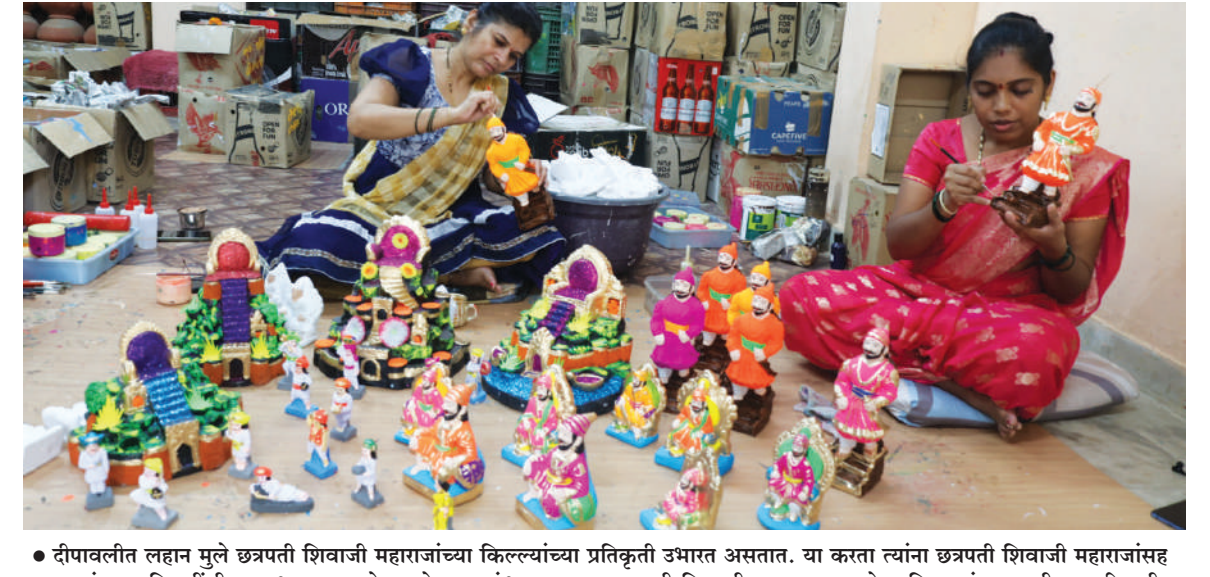
● दीपावलीत लहान मुले छत्रपती शिवाजी महाराजांच्या किल्ल्यांच्या प्रतिकृती उभारत असतात. या करता त्यांना छत्रपती शिवाजी महाराजांसह मावळींच्या प्रतिकृतीची गरज भासत असते. पनवेलच्या कुंभार वाड्यात छत्रपती शिवाजी महाराज, मावळे व किल्ल्यांच्या मातीच्या प्रतिकृती बनवण्याचे काम जोरदार सुरू आहे.