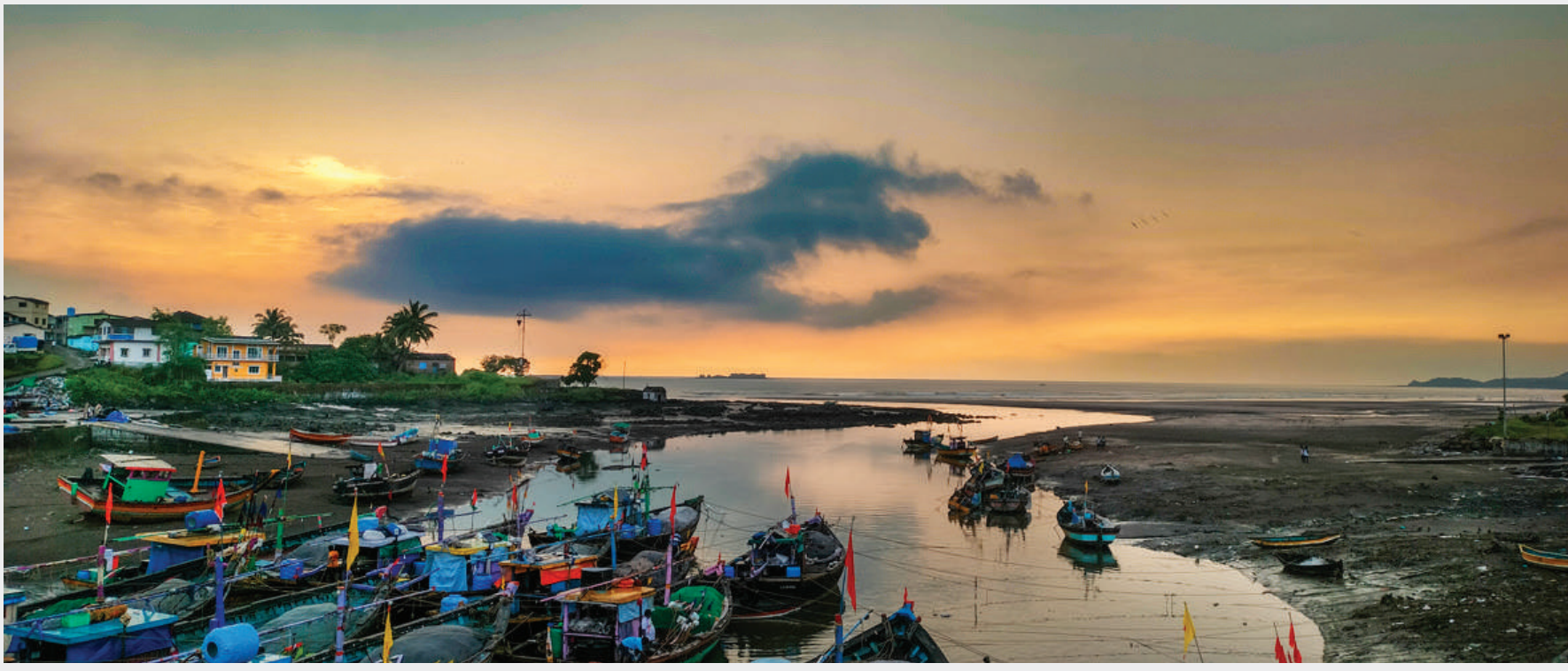
● मुरुड तालुक्यात कधी ऊन तर कधी पाऊस असे वातावरण असताना संध्याकाळच्या सुमारास समुद्रकिनारी आभाळात वेगवेगळ्या रंगाच्या छटांची उधळना पाहायला मिळाली.