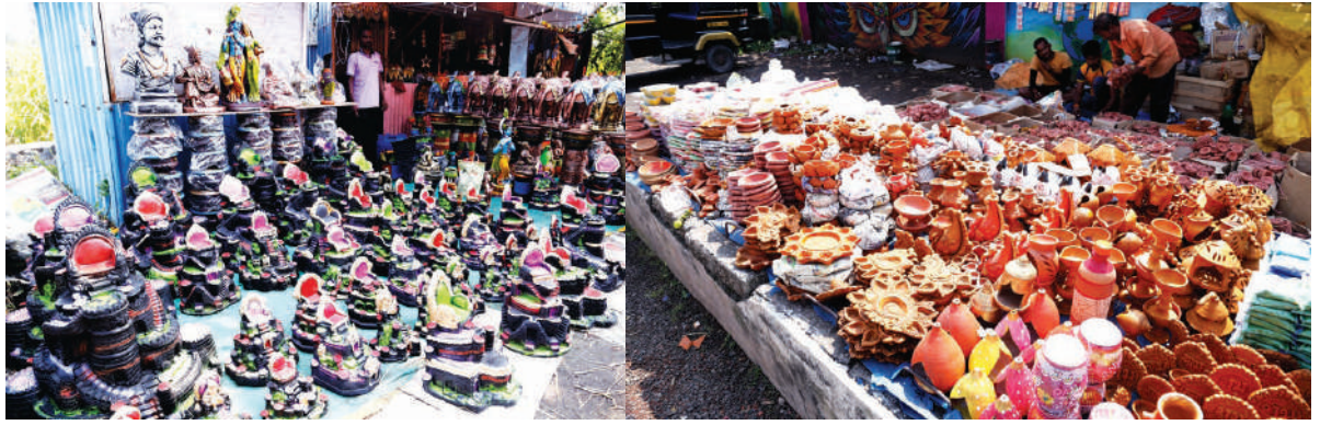
● दिवाळी सुट्टीत लहान मुले मातीचे किल्ले बनवत असतात. परंतु, माती मिळत नसल्याने प्लास्टर ऑफ पॅरिस पासून बनवलेल्या किल्ल्यांना जास्त मागणी आहे. म्हणून असे विविध आकाराचे किल्ले बाजारात विक्रीसाठी आले असून २५० रुपयांपासून हजार रु. किमतीपर्यंत हे किल्ले विकले जात आहेत. तसेच, विविध प्रकारचे व आकाराचे चिनी मातीपासून बनवलेले आकर्षक दिवे अलिबाग बाजारपेठेत विक्रीसाठी आले आहेत.

होत आले असून त्यांच्या नातेवाईक, मित्रमंडळीकडे जाऊन चौकशी केली तरी देखील त्यांचा ठावठिकाणा लागला नाही. तरी पोलीस या महिला आणि पुरुष यांचा कसून तपास करत असून हे दोघेही आपल्या गावात अगर आजूबाजूचे परिसरात निदर्शनास आल्यास तात्काळ वावोशी दुरुक्षेत्र व खालापूर पोलीस ठाणे यांना संपर्क करावा, अशी विनंती सर्व नागरिकांना करण्यात आली आहे.