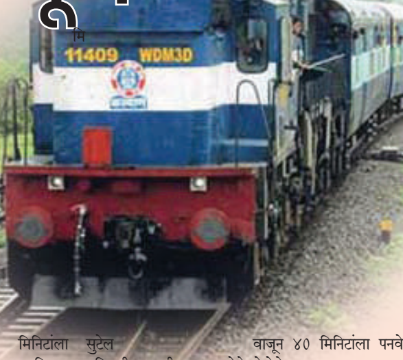
मिनिटांला सुटेल आणि दुसऱ्या दिवशी सकाळी ०८ वाजून ४० मिनिटांला पनवेल येथे पोहोचेल.

स्थानकावरून रात्री ११ वाजून २५ मिनिटांला सुटेल आणि दुसऱ्या दिवशी दुपारी १२ वाजून १५ मिनिटांला पुणे येथे पोहोचेल. ०११७७/०११७८ पनवेल सावंतवाडी पनवेल ट्रेन (एकूण आठ फेऱ्या) ०११७७ : विशेष गाडी दिनांक २२ ऑक्टोबर ते १२ नोव्हेंबरपर्यंत दर बुधवारी पनवेल स्थानकावरून सकाळी ०९ वाजून ४० मिनिटांला सुटेल आणि त्याच दिवशी रात्री ११ वाजून ०५ मिनिटांला सावंतवाडी येथे पोहोचेल. ०११७८ विशेष गाडी दिनांक २३ ऑक्टोबर ते १२ नोव्हेंबरपर्यंत दर गुरुवारी सावंतवाडी स्थानकावरून रात्री ११ वाजून २५