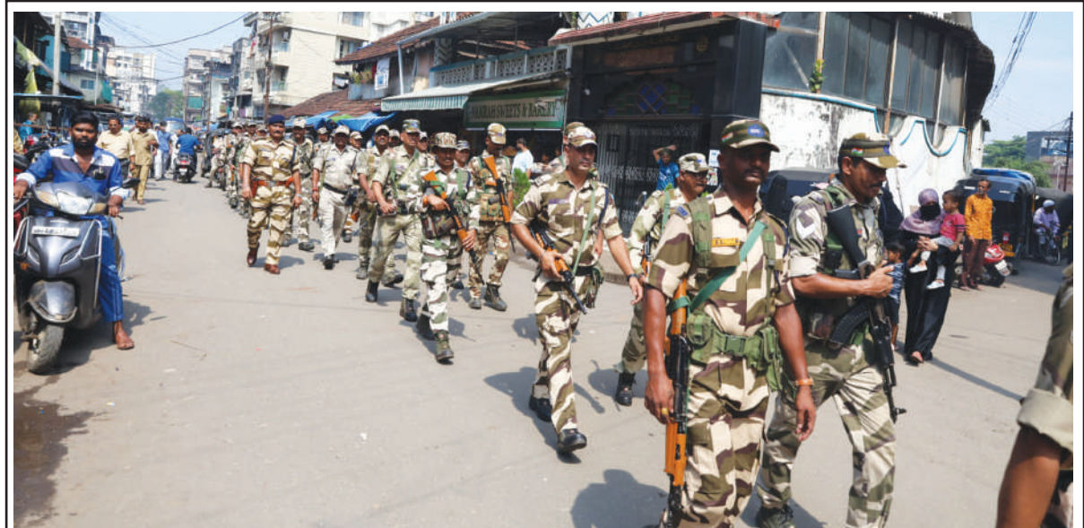
● राज्यात होणाऱ्या विधानसभा निवडणुकी निमित्त पनवेल शहर पोलीसकडून पनवेल शहरात लॉनामार्च काढण्यात आला. निवडणूका शांतातम्य वातावरणात होण्याकरीता पोलीस दल सक्षम असल्याचा संदेश याद्वारे देण्यात आला.