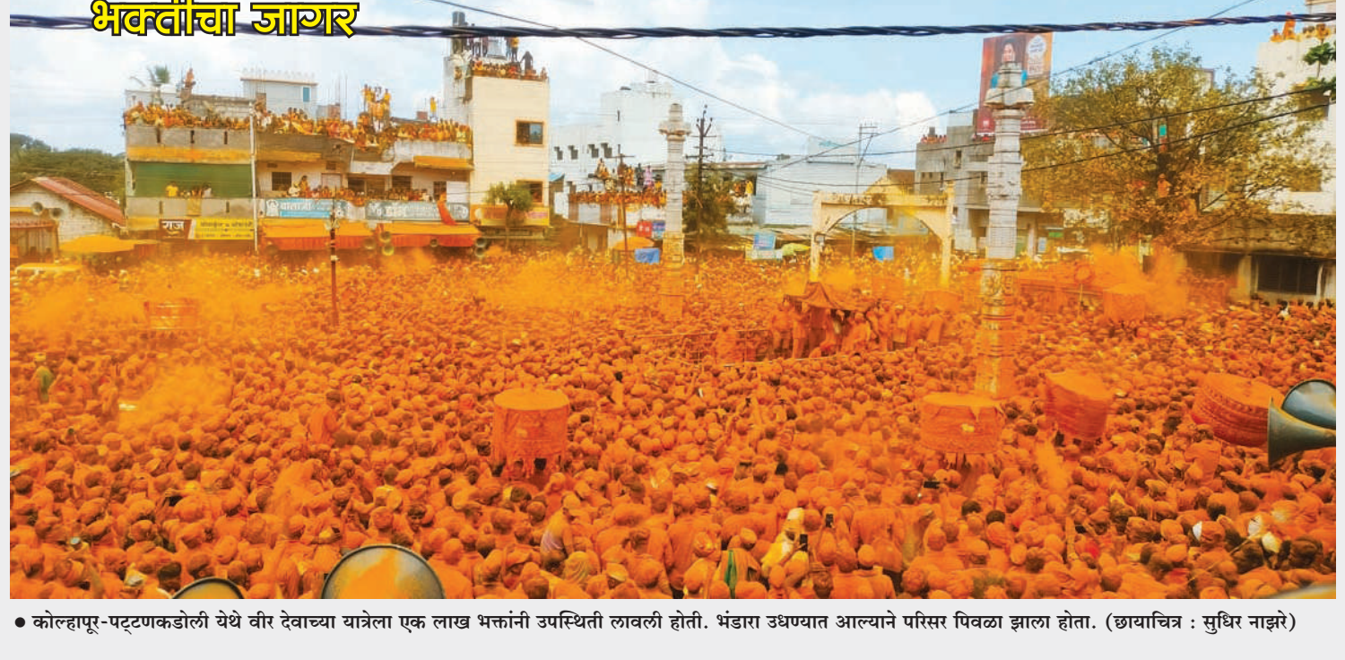
● कोल्हापूर-पट्टणकडोली येथे वीर देवाच्या यात्रेला एक लाख भक्तांनी उपस्थिती लावली होती. भंडारा उधण्यात आल्याने परिसर पिवळा झाला होता.