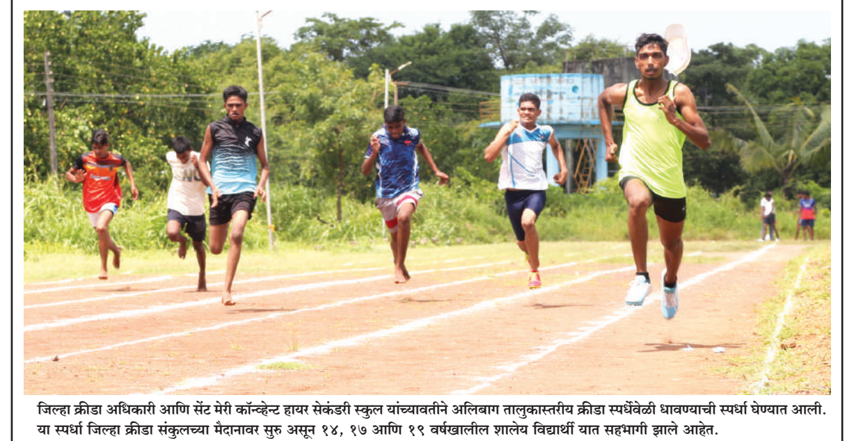
जिल्हा क्रीडा अधिकारी आणि सेंट मेरी कॉन्व्हेंट हायर सेकेंडरी स्कूल यांच्यावतीने अलिबाग तालुक्यावरील क्रीडा स्पर्धेवेळी धावण्याची स्पर्धा घेण्यात आली. या स्पर्धा जिल्हा क्रीडा संकुलच्या मैदानावर सुरु असून १४, १७ आणि १९ वर्षांखालील शालेय विद्यार्थी यात सहभागी झाले आहेत.

स्टर्लिंगला ५२ धावांवर माघारी परतला. रॉसने ५८ चेंडूंमध्ये शतक पूर्ण केले. एडर १०० धावांवर बाद झाला. त्यांना २० षटकांत ६ बाद १९५ धावा उभारता आल्या. दक्षिण आफ्रिकेने १९६ धावांचा पाठलाग करताना चांगली सुरुवात केली. परंतु, रायन रिक्लेटन ३६ धावांवर बाद झाला. यानंतर आलेल्या मॅथ्यू झील्डरने आणि रिझा हेंड्रिक्स या दोघांनी वैयक्तिक अर्धशतक झळकावताना संघाला विजयाच्या दिशेने नेले होते. पण, एडरने ४ बळी घेतले आणि त्याला ग्रॅहम ह्युमची (३ बळी) साथ मिळाली. आफ्रिकेला ९ बाद १८५ धावाच करता आल्या.