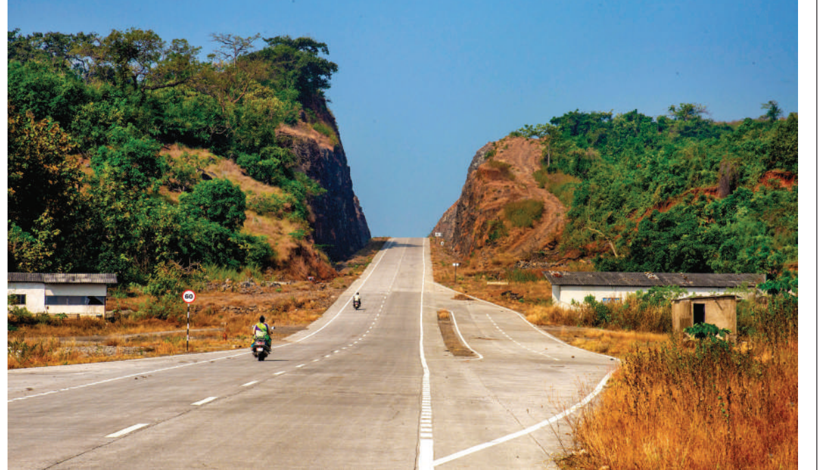
● मुरुड-आंगरदांडा इंदापूर रस्ता ४ परती झाल्याने पर्यटकांचा प्रवास सुखाचा झाला आहे. आंगरदांडा येथे डोंगर कापून रस्ता बनल्याने पर्यटक खास थांबून सेल्फी काढण्यासाठी थांबतात.

लोणाकंपनीच्या शेजारी नाल्याचे पाणी रस्त्यावर येत असल्यामुळे हा रस्ता बंद होतो तर पुढे रेल्वे पुलाजवळ पुलाखाली पाणी साचल्यामुळे रस्ता बंद होतो. ज्या ठिकाणी रस्ता उंच खाली आहे, त्या ठिकाणी रस्ता उंच करण्याची गरज आहे. कारण नदीचे पात्र लागतच असल्यामुळे नदीचे पाणी रस्त्यावर येते. यासाठी उपाययोजना करणे गरजेचे आहे. तसेच नदीच्या पात्रात बांधकामे केली असल्यामुळे नदीचे पात्र अरुंद झाले आहे. त्यामुळे पाणी रस्त्यावर येते. नदीच्या पात्राशेजारी बांधकामे होणार नाहीत याची दखल सार्वजनिक बांधकाम खात्याने घेऊन रस्ता तयार करावा अशी मागणी होत आहे.