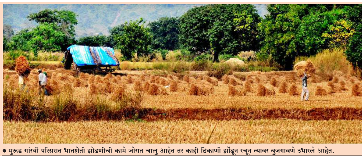
● मुरुड गांभी परिसरात भातशेती झोडणीची कामे जोरात चालू आहेत तर काही ठिकाणी झोंडून रचून त्यावर बुजगावणे उभारले आहेत.