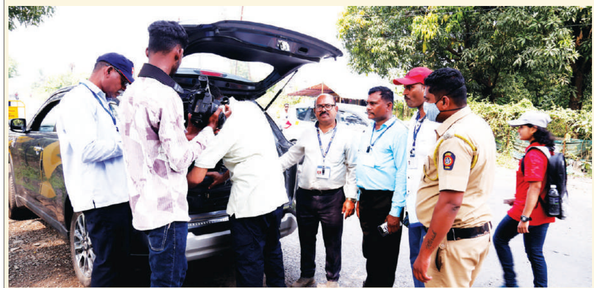
● विधानसभा निवडणुकीत आचारसंहिता भंग होऊ नये त्याचबरोबर वाहनांमधून होणारी अवैध दारूची आणि पैशांची वाहतूक रोखण्यासाठी चेकपोस्टवर निवडणूक विभागाकडून व्हीएसटी पथक तैनात करण्यात आले आहेत. पेण-अलिबाग मार्गावरील पेझारी येथील चेकपोस्टवर वाहनांची व्हिडीओ शुटिंगसह तपासणी करणारे पथक