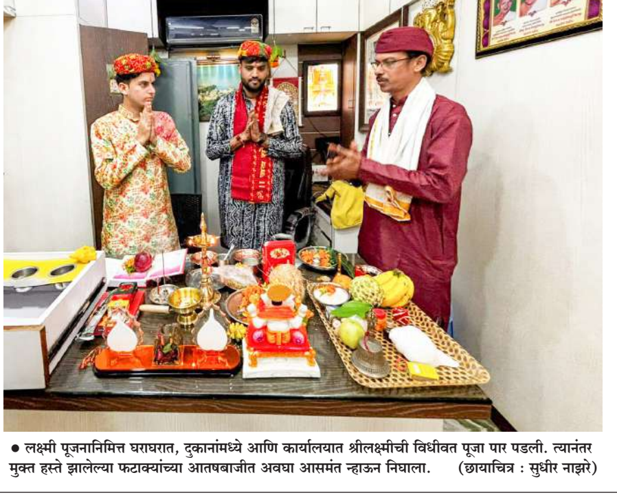
● लक्ष्मी पूजननिमित्त घराघरात, दुकानांमध्ये आणि कार्यालयात श्रीलक्ष्मीची विधीवत पूजा पार पडली. त्यानंतर मुक्त हस्ते झालेल्या फटाक्यांच्या आतषबाजीत अवघा आसमंत न्हाऊन निघाला.