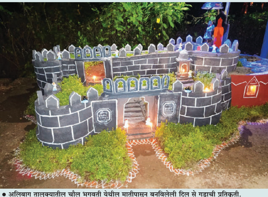
● अलिबाग तालुक्यातील चोल भगवती येथील मातीपासून बनविलेली दिल से गडाची प्रतिकृती.