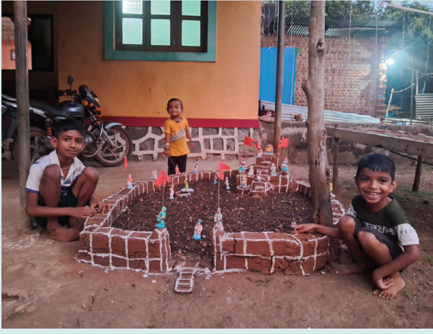
● अलिबाग तालुक्यातील महाजन येथील लहान मुलांनी बनविलेला किल्ला.