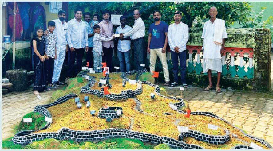
● दिवाळी सणानिमित्त मातीपासून किल्ल्यांची प्रतिकृती निर्माण करून चिमुकल्यांनी महाराष्ट्रातील किल्ले संवर्धनाचा संदेश दिला आहे. किल्ल्यांवर छत्रपती शिवाजी महाराज, मावळे, सैन्य, तोफ, वाघ, हत्ती, हरीण असे विविध प्राणी ठेवण्यात आले आहेत. तसेच, तोफेची जागा, भुयारी मार्ग, नगर खाना, दारु गोळा, गुप्त बैठक, पाण्याचे होद, तलाव, विहीर, गुर्गाचा गोदा, मंदिर, मावळ्यांचा राहण्याचा निवास जणू दाखविण्यात आला आहे.