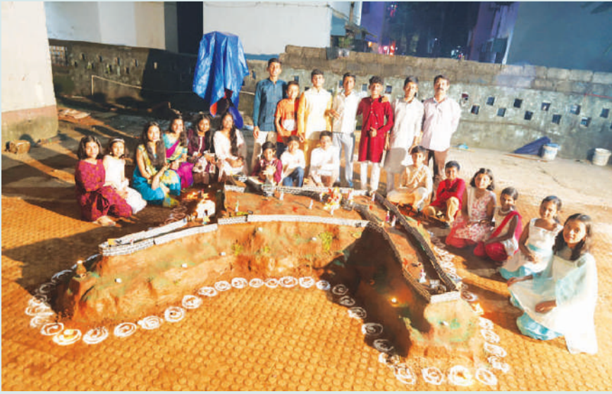
● पनवेल तालुक्यातील खांदा वसाहत सेक्टर ८ मधील सी टाईप सरोदय सोसायटीमधील लहान मुलांनी छत्रपती शिवाजी महाराजांच्या प्रतापगड किल्ल्याची प्रतिकृती उभारली आहे.