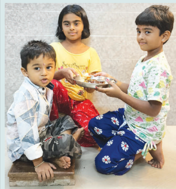
● लहानगी बहीण आपल्या लहान भावाला ओवाळणी करून भाऊ बहिणीच्या नात्याचा विश्वास दृढ करीत आहेत.