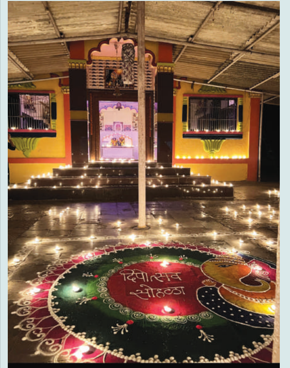
● शिहू येथील श्री बहिश्वर जोगेश्वरी मंदिरात लक्ष्मीपूजनचे औचित्य साधून दीपोत्सव मोठ्या उत्साहाने साजरा करण्यात आला. यावेळी २ हजार दिव्यांनी आणि आकर्षक रांगोळ्यांनी मंदिर परिसर सजविण्यात आला होता. यात तरुणांसह महिलांनीही बहुसंख्येने सहभाग घेतला होता.