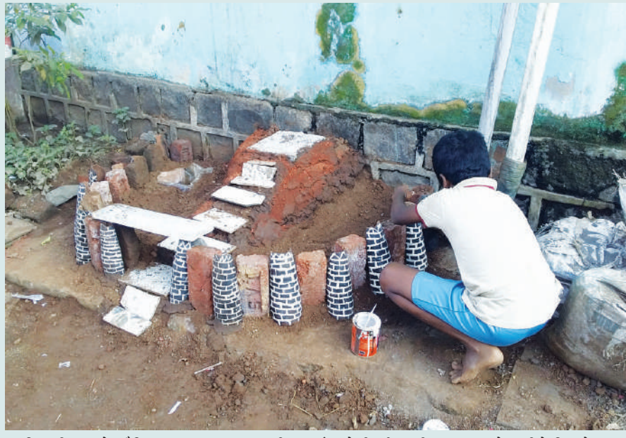
● दिवाळी सणाचे औचित्य साधून मुरुड शहरातील व पंचक्रोशी परिसरातील लहान मुले मातीचे किल्ले तयार करत आहेत. या किल्ल्यांवर छत्रपती शिवाजी महाराज, तोफा, मावळे, तोफ, किल्ल्याचे प्रवेशद्वार, शेतकरी, महिला-पुरुष, द्वारपाल यांच्या प्रतिकृतीची खरेदी करण्यात आल्या आहेत.