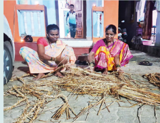
● दिवाळीत भातकाणीला सुरवात झाली असून भाताचे भारे बांधण्यासाठी लागणारे दोरे वळताना महिला वर्ग.