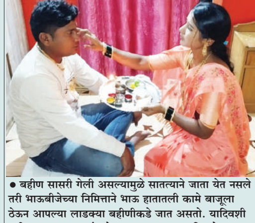
● बहीण सासरी गेली असल्यामुळे सातत्याने जाता येत नसले तरी भाऊबीजेच्या निमित्ताने भाऊ हातातली कामे बाजूला ठेऊन आपल्या लाडक्या बहीणीकडे जात असतो. यादिवशी बहीण भावाच्या अखंड प्रेमाचा झरा वाहताना दिसतो.