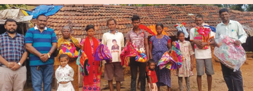
रेड हाऊस फाऊंडेशन यांनी आदिवासी बांधवांना

। माणगाव । प्रतिनिधी । दिवाळी सर्वत्र आनंदाने साजरी होत असताना ज्या वाडी, वस्ती, पाड्यांवर दिवाळी साजरी होत नाही, ज्या ठिकाणी दिवाळीनिमित्ताने तसेच दैनंदिन गरजा पूर्ण करण्याच्या दृष्टीने नेहमीच ओढाताण असते, अशा ग्रामीण वाडी-वस्तींवर चारिड्येन फाऊंडेशन व