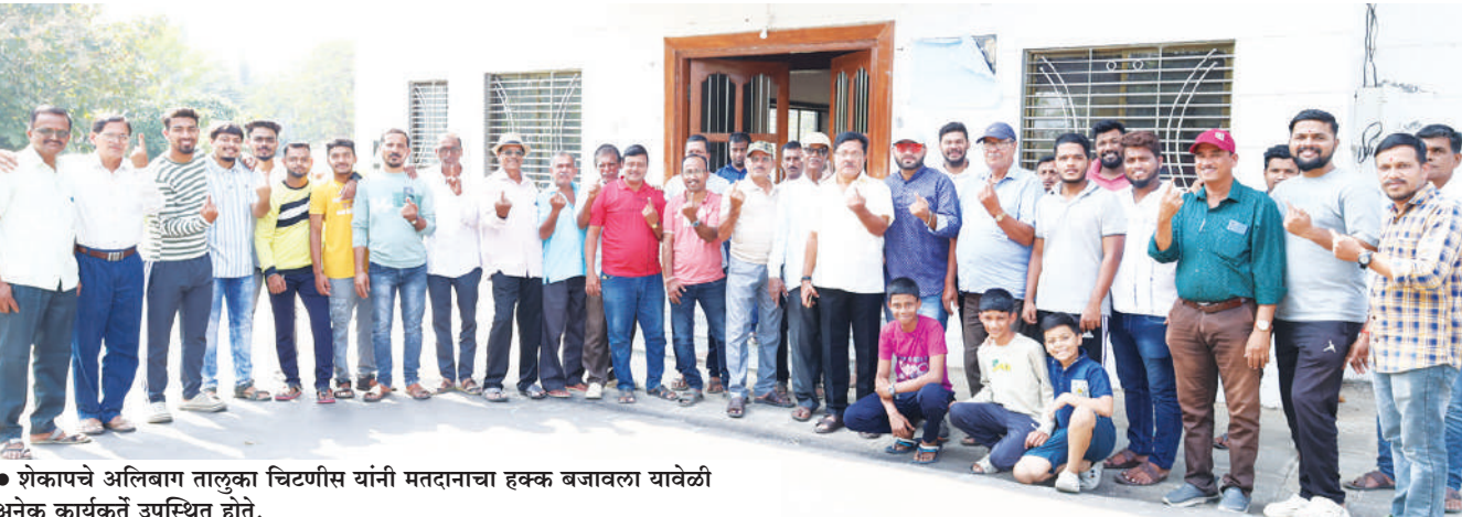
● शेकापचे अलिबाग तालुका चिटणीस यांनी मतदानाचा हक्क बजावला यावेळी अनेक कार्यकर्ते उपस्थित होते.