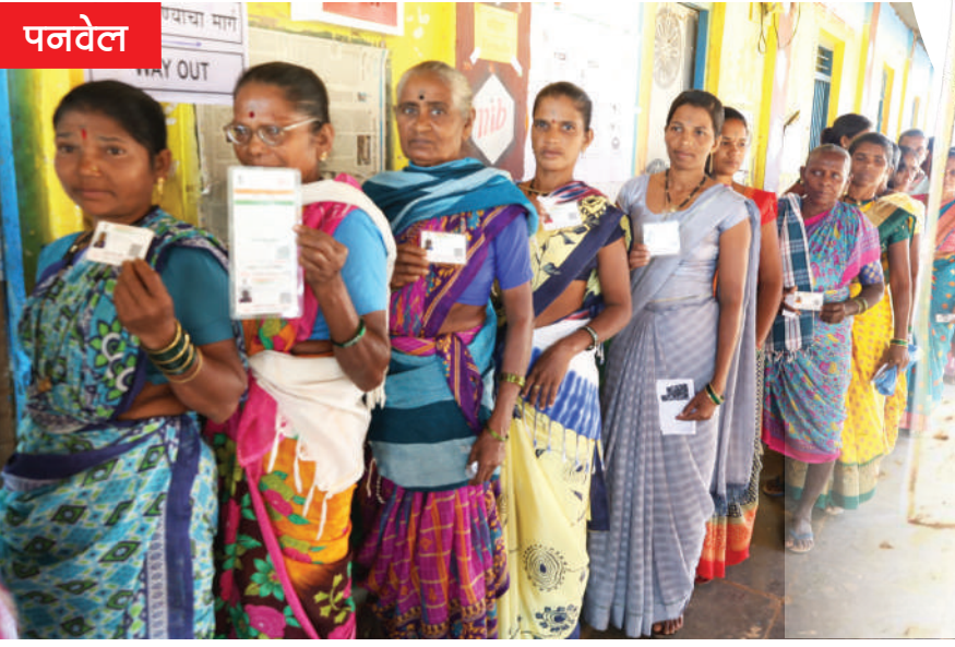
● पनवेल ग्रामीण

● पनवेल- मतदारांना मतदान करणे सुलभ व्हावे, यासाठी प्रशासनाकडून जोख व्यवस्था करण्यात आली होती. दरम्यान, बहुतांश मतदान केंद्रांवर सेल्फी पॉईंट उभारण्यात आला होता. यावेळी मतदारांनी मतदान केल्यानंतरची आपली छबी याठिकाणी काढल्याचे दिसून आले. त्याचप्रमाणे मतदारांना आकर्षक करण्यासाठी अनेक ठिकाणचे मतदार केंद्रे आकर्षक रंगरंगोटी करून सजविण्यात आली होती. लोकशाहीचा हा उत्सव आनंदाने साजरा व्हावा, यासाठी जिल्हाभरातील प्रशासन कामाला लागल्याचे प्रत्येक ठिकाणी दिसून आले.