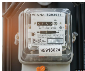
दुप्पट ते तिप्पट वाढ करून वीजबिल पाठवण्यात आले आहे.

महावितरणकडून देण्यात येणारे वीज देयक वेळेवर न भरणा केल्यास वीजजोडणी तत्काळ बंद केली जाते; मात्र ग्राहकांनी वाढीव बिलासंदर्भात तक्रार केल्यास त्याकडे दुर्लक्ष केले जाते. महावितरणच्या वरिष्ठांनी ग्रामस्थांना वाढीव वीजबिले का देण्यात आली? या विषयी कर्मचाऱ्यांकडे विचारणा करावी, तसेच योग्य प्रकारे वीजबिले देण्यात यावी, अशी मागणी ग्रामस्थांकडून केली जात आहे.