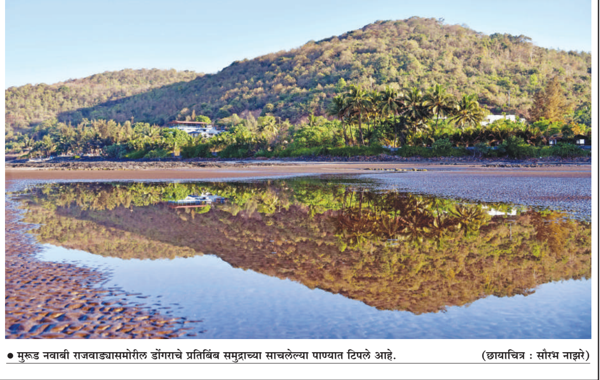
● मुरुड नवाबी राजवाड्यासमोरील डोंगराचे प्रतिबिंब समुद्राच्या साचलेल्या पाण्यात टिपले आहे.

येईल? आताची साठवण क्षमता आणि पाणलोट क्षेत्राची रूंदी वाढविल्यानंतर वाढीव पाण्याचा दाब बंधारा पेलवू शकेल का? या तांत्रिक बाबींची तपासणी करून शक्य होत असेल तर बोर्लीपंचतन गावाची वाढती लोकसंख्या व वेगाने होणारा विस्तार पाहता पाणी साठवण क्षेत्राची रूंदी वाढविल्यास जादा जमा झालेल्या पाण्यामुळे आणखी दिड-दोन महिने तरी पाणी