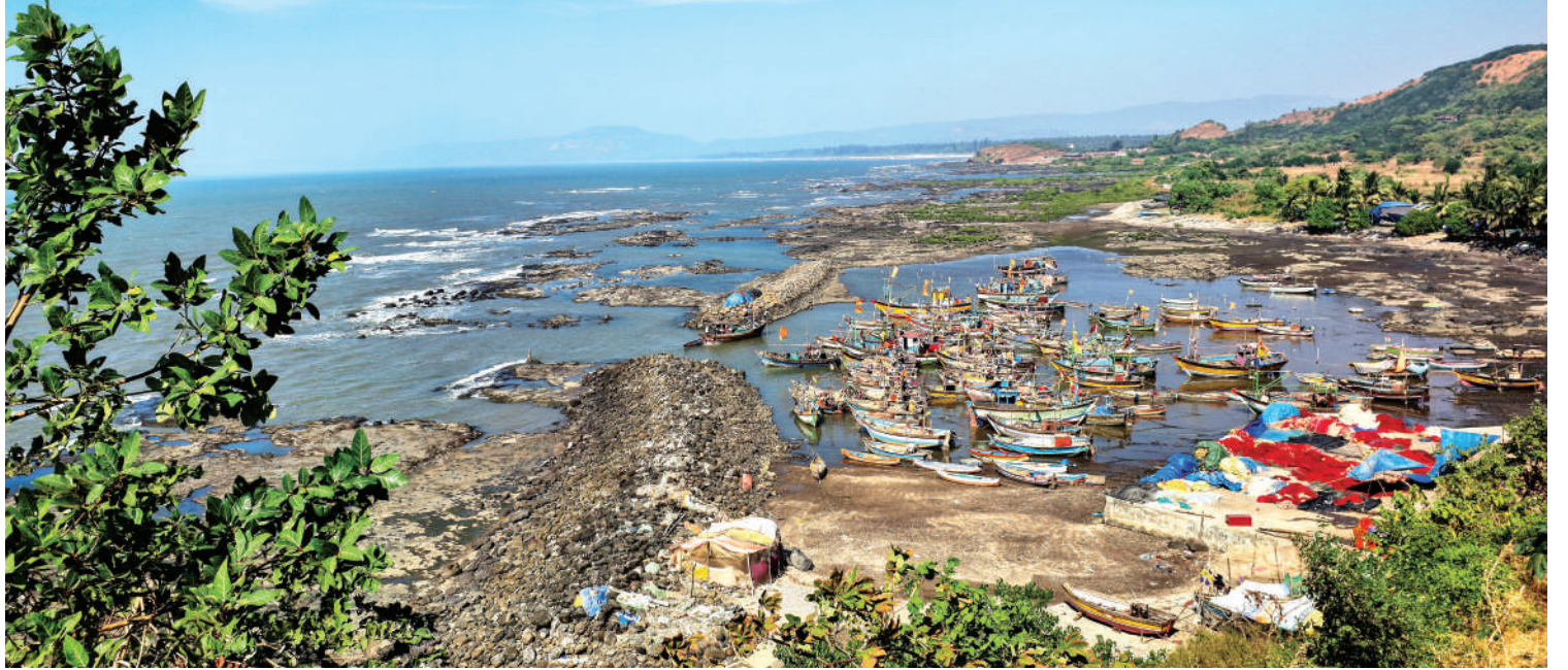
● श्रीवर्धन तालुक्यातील भरडखोल येथील डागी बंदराचे विहंगम दृश्य.