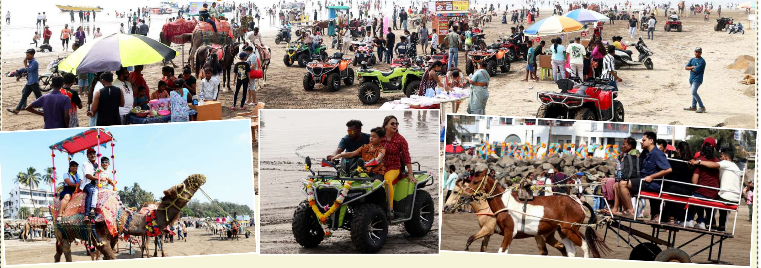
● सलग तीन दिवस सुट्ट्या आल्याने रायगड जिल्हातील पर्यटन स्थळ पर्यटकांनी बहरले होते. अलिबाग समुद्रकिनारी घोडगाडी सफर, उंटावरून सफारी आणि एटीएम बाईक राईडची मजा पर्यटकांनी मनसोक्त लुटली. चामुळे स्थानिक व्यावसायिकांना चांगला धंदा मिळाला. दरम्यान, समुद्राला ओहोटी लागल्याने अलिबाग समुद्रकिनारी पर्यटनाला आलेल्या पर्यटकांनी शिवकालीन कुलाबा किल्ल्यात चालत जाणे पसंत केले. तीन दिवसात हजारो पर्यटकांनी किनाऱ्यावर मौज, मस्ती, धम्माल केल्याचे दिसून आले.