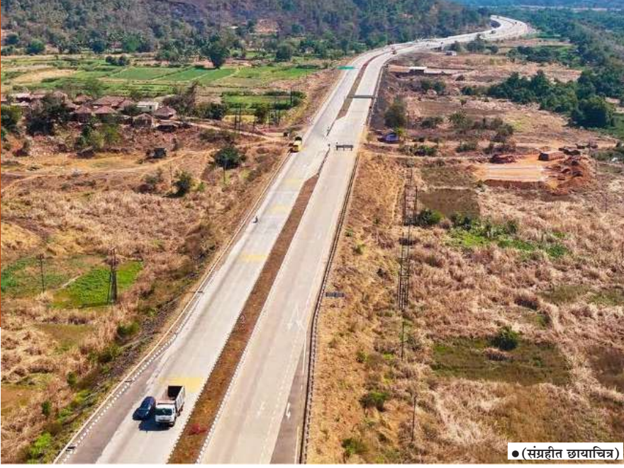
● (संग्रहित छायाचित्र)

मुंबई-गोवा महामार्गावरील वडखळपर्यंतच्या रस्त्याचे बहुतांश काम पूर्ण झाले आहे; मात्र नागोठणे, कोलाड, पुई, माणगाव येथील प्रमुख पुलांचे काम अद्याप वेग घेऊ शकलेले नाही. पळस्ये ते इंदापूर हा ८४ किलोमीटरचा रस्ता सर्वात तापदायक होतो. याचे दोन टप्प्यांत विभाजन केल्यानंतर