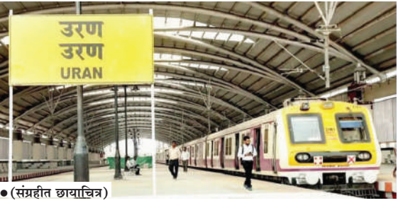
● (संग्रहित छायाचित्र)