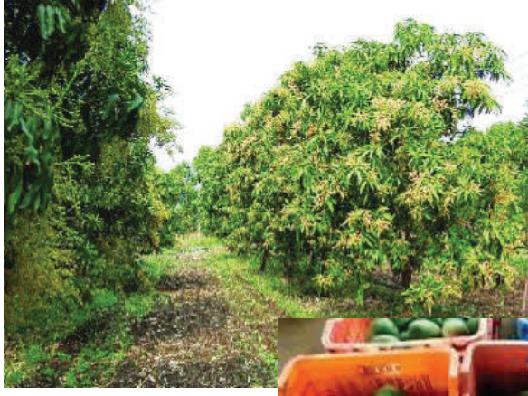
लागवड शेतकरी करीत असल्याचे चित्र आहे.

। अलिबाग । प्रमोद जाधव । बदलत्या हवामान अवकाळी पाऊस अशा अनेक समस्यांमुळे आंबा उत्पादक शेतकरी कायमच संकटात सापडला आहे. त्यामुळे या शेतकऱ्यांनी फळपीक विमा उतरवण्यासाठी पुढाकार घेतला आहे. यावर्षी सात हजार ७३४ शेतकऱ्यांनी विमा उतरविला आहे. गतवर्षीच्या तुलनेने यावर्षी एक हजारहून अधिक शेतकऱ्यांनी विमा काढल्याची माहिती कृषी विभागकडून प्राप्त झाली आहे.