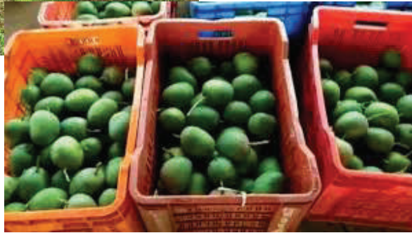
असल्याची माहिती समोर येत आहे.

जिल्ह्यामध्ये वीस हजारहून अधिक आंबा उत्पादक शेतकरी आहेत. आंब्याचे क्षेत्र वाढावे शेतकऱ्यांना त्यातून उत्पन्न मिळावे यासाठी कृषी विभागकडून प्रोत्साहन दिले जाते. त्यामुळे तरुणाई देखील आंबा लागवडीवर भर देत आहे. मात्र जिल्ह्यामध्ये अवकाळी पाऊस पडणे वातावरणात बदल होणे या प्रकारामुळे आंबा उत्पादनावर