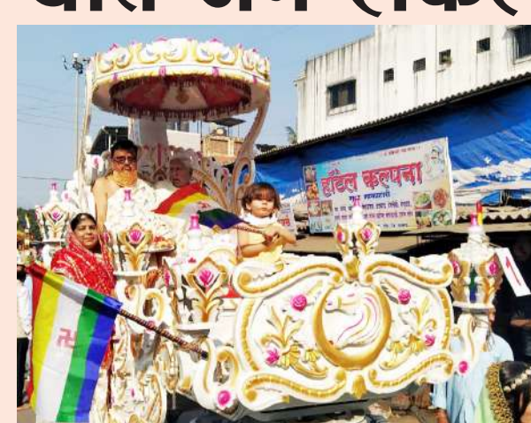
उत्साहात संपन्न झाली. जैन धर्मियांचे सर्वांत मोठे