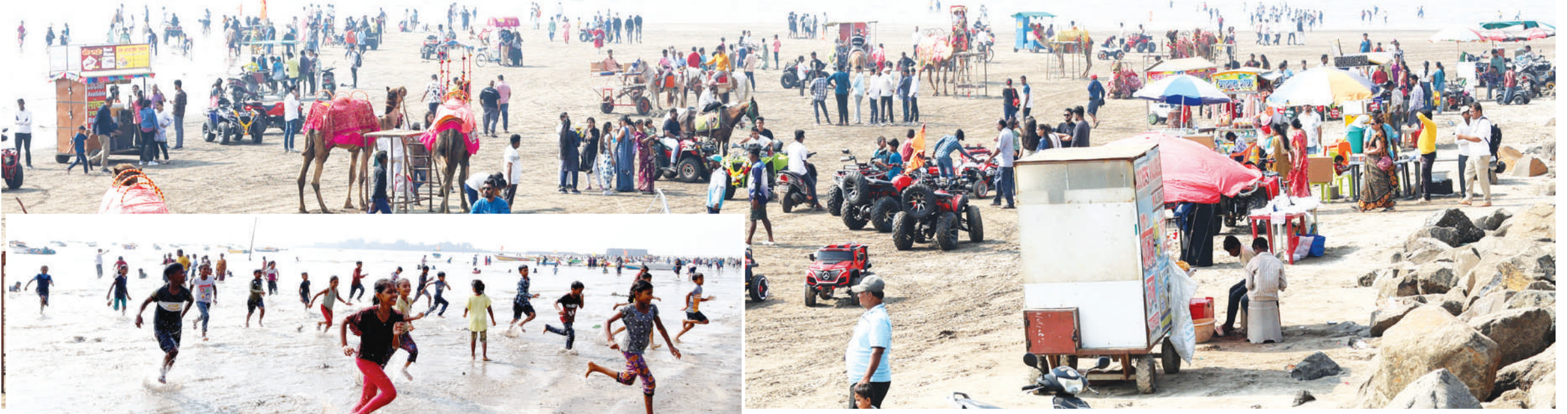
● अलिबाग समुद्रकिनारी शनिवार-रविवारची मजा लुटण्यासाठी मुंबई, पुणे, नाशिक येथील पर्यटकांनी मोठ्या प्रमाणात गर्दी केली होती. यावेळी शैक्षणिक सहलीसाठी आलेल्या विद्यार्थ्यांनी देखील पाण्यात मनसोक्त डुबत समुद्रनानाची मजा लुटली.