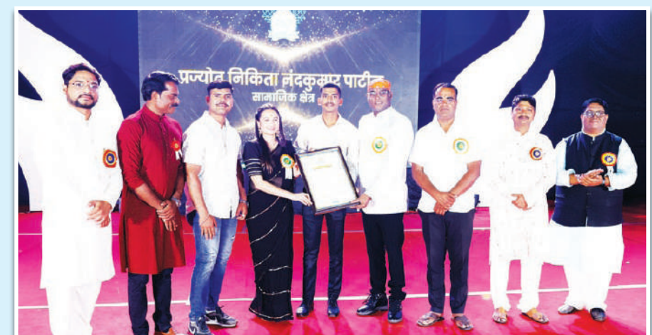
प्रभाविष्काराच्या समारोपावेळी सादर झालेल्या महागायकाच्या प्रभाविष्काराच्या सादरीकरणात पीएनपी वेव्ही शैक्षणिक संकुलाद्वारे प्रभाविष्कार या