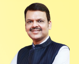
देवेंद्र फडणवीस मुख्यमंत्री