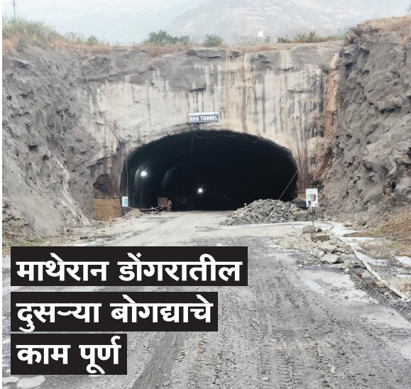
माथेरान डोंगरातील दुसऱ्या बोगद्याचे काम पूर्ण

। पनवेल। प्रतिनिधी। बडोदा-मुंबई महामार्गाच्या शेवटच्या पॅकेजमधील माथेरान डोंगर रांगांखालील शिरवली गावालगतचा पहिल्या बोगद्याचे खोदकाम ऑगस्ट महिन्यात आरंभ झाल्यानंतर दुसरा बोगद्याचे खोदकाम कधी पूर्ण होईल, याकडे सर्वांचे लक्ष लागले होते. सध्या दुसऱ्या बोगद्याचे खोदकाम आरंभ झाले असून जुलै २०२५ पर्यंत हे काम पूर्ण करण्याच्या जोरदार हालचाली प्राधिकरणाकडून सुरु आहेत. या दुहेरी बोगद्यामुळे आणि प्रशस्त महामार्गांमुळे काही मिनिटांत बदलापूर येथील नागरिकांना पनवेल, उरण जेएनपीटी बंदरामध्ये आणि नवी मुंबई आंतरराष्ट्रीय विमानतळ प्रकल्पपर्यंत पोहचता येणार आहे. सिडकोची दक्षिण नवी मुंबई म्हणजेच नवी मुंबई विमानतळ