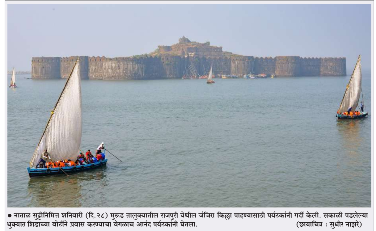
नाताळ सुट्टीनिमित्त शनिवारी (दि. २८) मुरुड तालुक्यातील राजपुरी येथील जंजिरा किल्ला पाहण्यासाठी पर्यटकांनी गर्दी केली. सकाळी पडलेल्या धुक्यात शिडाच्या बोटीने प्रवास करण्याचा वेगळाच आनंद पर्यटकांनी घेतला.

पनवेल : कामोटे भागातून अपहरण करून अहमदनगर मधील नेवासा येथे नेण्यात आलेल्या ७ वर्षीय मुलाचा कामोटे पोलिसांनी अवघ्या ६ तासांमध्ये शोध घेतला आहे. या प्रकरणाच्या तपासानंतर अपहृत मुलाला त्याच्या वडीलानेच नेवासा येथे नेल्याचे उघडकीस आले आहे. अपहृत मुलाचे आई-वडील मागील चार-पाच वर्षांपासून वेगळे राहत आहेत. हा मुलगा आईकडे राहण्यासाठी गेल्यानंतर भंगार गोळा करत असल्याचे निदर्शनास आल्यानंतर वडिलांनी मुलाला सोबत नेल्याचे पोलीस तपासात निष्पन्न झाले आहे. या मुलाच्या आई-वडिलांचा कायदेशीर घटस्फोट न झाल्यामुळे सध्या मुलाचा ताबा त्याच्या पित्याकडे देण्यात आला आहे.