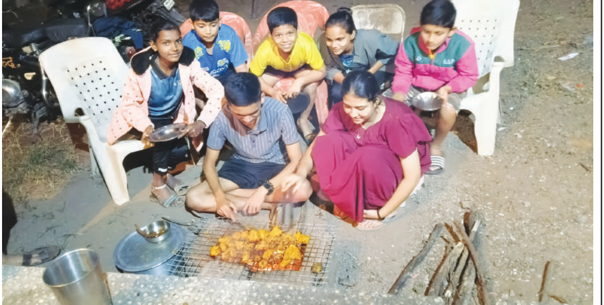
अलिबाग : थर्टी फर्स्टच्या पार्वभूमीवर सर्वत्र पाट्यांचे बेत आखले जात आहेत. परंतु, ३१ तारखेला मंगळवार आल्याने अनेकांनी रविवारीच पाट्यां आयोजित केल्या होत्या. महाजन येथील बच्चोकंपनीने जाळी चिकन करून चांगलाच ताव मारत पार्टी मस्तपैकी एन्जॉय केली.