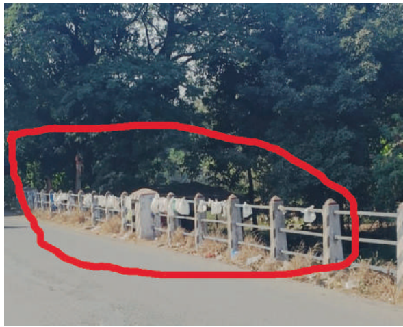
● आंबेघर पुलाच्या रेलिंगला अडकलेल्या कचऱ्याच्या पिशव्या.

। पेण । प्रतिनिधी । पेण शहराच्या सर्वांगीण प्रगतीची महत्त्वाची बाब आहे ती म्हणजे भोगावती नदी. परंतु, आज भोगावती नदीला सर्व बाजूने प्रदूषित करण्याचा विडाच जणू काही पेणकरांनी उचललेला आहे.