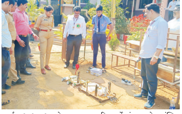
प्रदर्शन २०२४-२५ चे उद्घाटन उपविभागीय पोलीस अधिकारी

म्हसळा हा ग्रामीण आणि डोंगराळ तालुका असून, शहरासारखे मार्गदर्शन आणि प्रयोगासाठी लागणाऱ्या अद्यावत साहित्य मिळत नाही त्याही परिस्थितीत या तालुक्यातील ग्रामीण भागातील विद्यार्थ्यांनी आपले नैपुण्य सिद्ध करण्याचा यशस्वी प्रयत्न केला असून, त्यांचे जेवढे कौतुक करावे तेवढे कमी आहे, असे गौरवाने सांगून विद्यार्थ्यांचे मनोर्षय वाढविले.