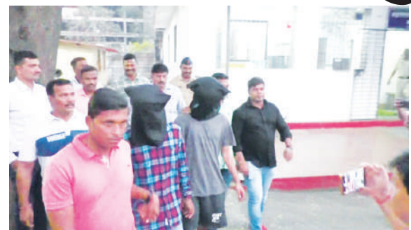
इसमाविरुद्ध गुन्हा नोंद करण्यात आला होता. आरोपीचा शोध घेत असताना