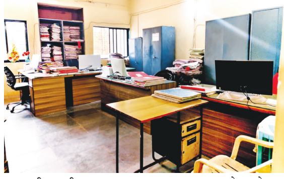
बुधवारी सकाळी ९.५० वाजता कार्यालयात पाहणी केली असता संपूर्ण पंचायत समिती कार्यालयात

। पेण । प्रतिनिधी । “कृष्याची शेपट नळीत घातली तरी ती वाकडीच” ही म्हण पेण पंचायत समितीच्या कर्मचाऱ्यांच्या कामकाजावर अक्षरशः लागू पडत असल्याचे चित्र समोर आले आहे. दोनच दिवसांपूर्वी नव्याने निवडून आलेल्या सभापती, उपसभापती आणि लोकप्रतिनिधींनी कर्मचाऱ्यांना वेळेवर उपस्थित राहण्याची स्पष्ट तंबी दिली होती. मात्र, त्या सूचनांकडे सरळ दुर्लक्ष करत “हम नहीं सुधरेंगे” अशीच भूमिका कर्मचाऱ्यांनी घेतल्याचे वास्तव समोर आले आहे.