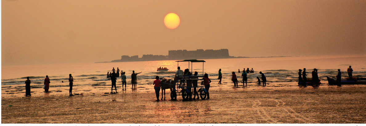
● मुरुड किनाऱ्यावर रविवार सुंदर संध्याकाळचा सुर्यास्तवेळी सोनेरी लाटामध्ये आनंद घेताना पर्यटक.

असणारे व्यावसायिक व मासळी विक्रेत्यांच्या चेहरा आनंदाने फुलला आहे. गेल्या दोन महिन्यांपासून दहावी व बारावी बोर्डाच्या तसेच इतर वर्गातील मुलांच्या परिक्षा सुरु होत्या. त्यामुळे बहुतांश पर्यटकांनी रायगड जिल्हाकडे पाठ फिरवली होती. मात्र, आता परिक्षा संपल्याने पर्यटकांची रेलचले जिल्ह्यात सर्वत्र दिसून येत आहे. मुरुड तालुक्यातील जंजिरा किल्ल्यासह मुरुड पासून जवळच असणारे गारंबी धारण, कुडे मांदाड लेणी, खोकरा व दर्मादेर पाहण्यासाठी पर्यटक दरवर्षी मोठ्या संख्येने मुरुडमध्ये हजेरी लावत