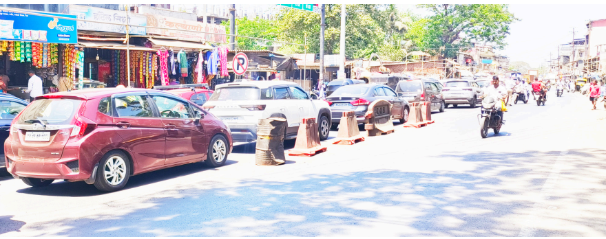
व्यक्त होत आहे.

उन्हाच्या तडाख्यात आणि प्रचंड गर्दीत नागरिकांना मोठ्या गैरसोयीला सामोरे जावे लागले. अनेकांना आपल्या कामाच्या ठिकाणी पोहोचण्यात उशीर झाला,