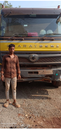
चालक गाडी सुसाट वेगाने चालवत होता. अशाप्रकारे सुसाट वाहन चालक वाहन चालवीत असल्यामुळे

। श्रीवर्धन । प्रतिनिधी । श्रीवर्धन तालुक्यात मागील काही दिवसांपासून विविध विकास प्रकल्प सुरू आहेत. या विकास प्रकल्पांवरती अनेक डंपर मटेरियलची वाहतूक करताना पाहायला मिळतात. त्याचप्रमाणे तालुक्यात उत्खनन करण्यात येणारे बॉक्साइट देखील डंपरद्वारे वाहतूक करण्यात येत असते. श्रीवर्धन हरीहरेवर मार्गावरील गालसुरे गावाच्या हद्दीत एक डंपर चालक, डंपरच्या पुढच्या बाजूला व मागच्या बाजूला कोणतीही नंबर प्लेट नसताना सुसाटपणे डंपर चालवत असल्याचे नागरिकांच्या लक्षात आले. सदर डंपर चालकाला नागरिकांनी अडविल्यानंतर तो थांबला. डंपर खाली करून येत असल्यामुळे रिकामा असल्याने डंपर अपघातांचा धोका दिवसेंदिवस वाढला आहे. अशा प्रकारे अपघात घडल्यास डंपरला कोणत्याही प्रकारची नंबर प्लेट नसल्यामुळे चालकाला पळून जाण्यास मोकळे रान मिळते. नुकतेच पेण येथील प्रादेशिक परिवहन विभागाने श्रीवर्धन तालुक्यात अनेक डंपरस वरती कारवाई देखील केली होती. परंतु इतके होऊन सुद्धा डंपर चालक व मालक मुजोरपणे गाड्या हाकत असल्यामुळे श्रीवर्धन तालुक्यातील जनतेमध्ये भीतीचे वातावरण निर्माण झाले आहे. तरी प्रादेशिक परिवहन विभाग पेण व स्थानिक पोलिसांनी सदर डंपर चालकाला शोधून काढून त्याच्यावती कडक कारवाई करण्याची मागणी नागरिकांमधून केली जात आहे.