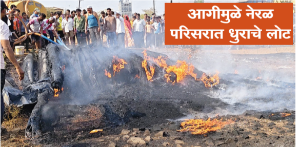
असून या आगीमुळे नेरळ परिसरात धुराचे लोट निर्माण झाले होते.

। नेळ । प्रतिनिधी । कर्जत तालुक्यातील आर्थिकदृष्ट्या सक्षम समजल्या जाणाऱ्या नेरळ ग्रामपंचायतीच्या नळपाणी योजनेचे काम अनेक वर्षे सुरू आहे. अनेक वर्षे खडलेल्या या नळपाणी योजनेचे मोहाची वाडी येथे पडून राहिलेले पाईप तेथे लागलेल्या आगीमध्ये जळून खाक झाले आहेत. त्यामुळे आता नेरळ ग्रामपंचायतीची नळपाणी योजना संकटात आली