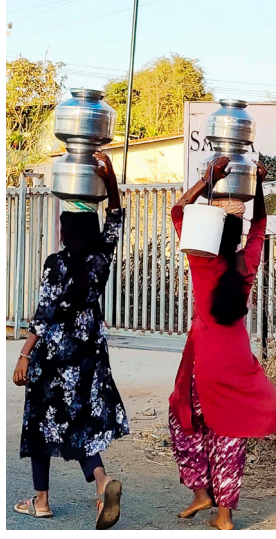
इमारत आहे आणि आता येथे

कशेले जामरुख रस्त्यावर पिंगळस गावच्या अलीकडे खांदन गाव आहे. या गावामध्ये जिल्हा परिषदेची शाळा आहे. अंगणवाडी