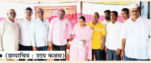
● (छायाचित्र : उदय कळसे)