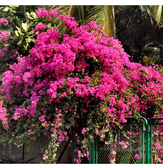
● मुरुड परिसरात ऋतु बदलाचे संकेत दिसू लागले आहेत, सर्वत्र पनमोहक रंगाची फुले फुलू लागली आहेत. कडक उन्हात सुखद सावली ही फुले देत आहेत.