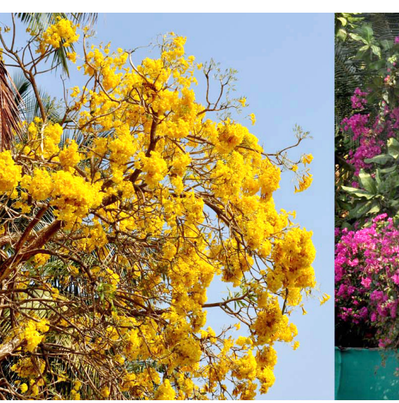
● मुरुड परिसरात ऋतु बदलाचे संकेत दिसू लागले आहेत, सर्वत्र पनमोहक रंगाची फुले फुलू लागली आहेत. कडक उन्हात सुखद सावली ही फुले देत आहेत.