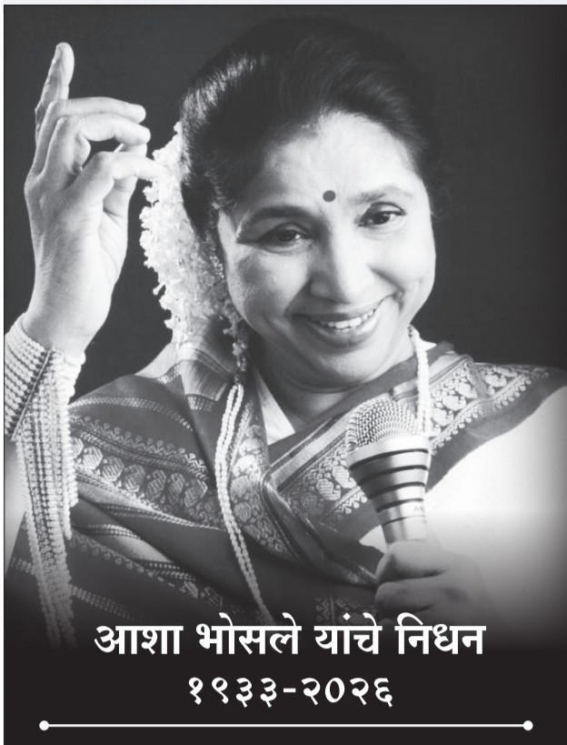
आशा भोसले यांचे निधन १९३३-२०२६