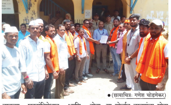
वाढत्या घटनांविरुद्ध आणि प्रशासनाचे डोळे उघडण्यासाठी विश्व हिंदू परिषद अंतर्गत बजरंग दलाच्यावतीने मुरूड शहरात जन आक्रोश मोर्चा काढण्यात आला

। आगरदांडा । प्रतिनिधी । मुरूड तालुक्यात वाढत असलेली बेकायदेशीर गोष्ट्या आणि गोवंश तस्करी ही सर्वांसाठी चिंतेची आणि संतापजनक बाब ठरत आहे. श्रद्धेचे प्रतीक असलेल्या गोमातेचे रक्त आपल्याच मातीत सांडत आहे. त्यामुळे गोहत्येच्या