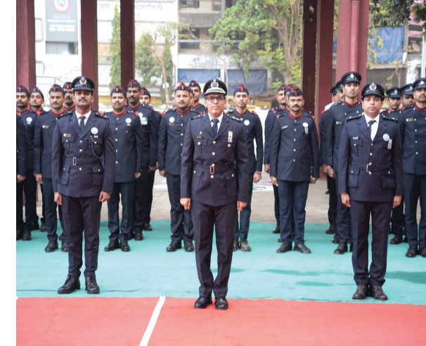
अग्निशमन सेवा दिनानिमित्त पनवेल महानगरपालिकेच्या अग्निशमन दलातर्फे शहिद जवानांना भावपूर्ण आदरांजली अर्पण करण्यात आली. कर्तव्य बजावताना प्राणाची आहुती देणाऱ्या वीर अग्निशमकांचे स्मरण करण्यात आले. यावेळी अधिकारी व जवानांनी त्यांच्या शौर्याला सलाम केला.