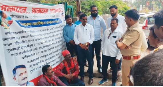
किरवलीपासून सुरुवात झालेली आहे.

कर्जत-कल्याण राज्य मार्ग ७६ ते जुम्मापट्टी हा मुख्यमंत्री ग्रामसडक योजनेतून मंजूर आहे. हा रस्ता तीन ग्रामपंचायतीमधून जात असून रस्त्याच्या कामाला