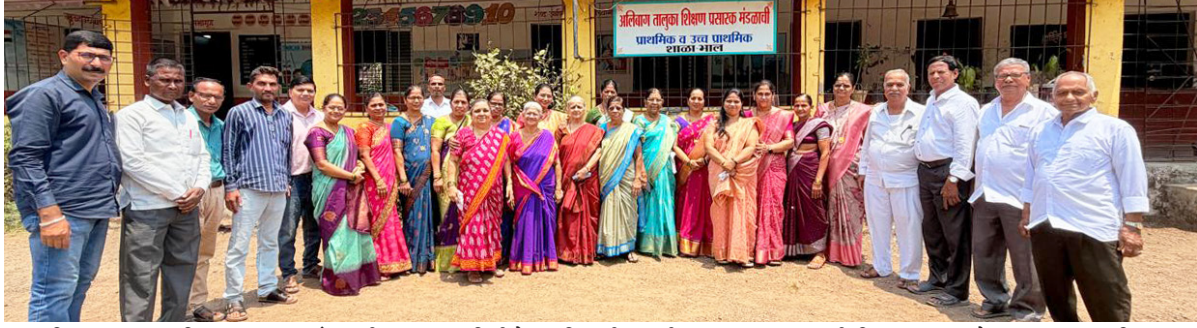
● अलिबाग तालुका शिक्षण प्रसारक मंडळातील शाळा समितीचे पदाधिकारी, माजी मुख्याध्यापक, माजी शिक्षक, सध्याचे मुख्याध्यापक, शिक्षक कर्मचारी वृंद यांचा गेट टुगेदर भाल येथील प्राथमिक व उच्च प्राथमिक शाळेत संपन्न झाले.

। पनवेल । प्रतिनिधी । कमळ महिला नागरी सहकारी पतसंस्था (म.) पनवेल ही संस्था महिलांसाठी नेहमीच विविध उपक्रम राबवित असते. यावर्षीही चैत्रगौरी निमित्त हळदी-कुंकू समारंभ मोठ्या उत्साहात आयोजित करण्यात आला. हा कार्यक्रम पतसंस्थेच्या कर्मचारी प्रशिक्षण केंद्र, पहिला मजला, जयभारत नाका, पनवेल येथे पार पडला.