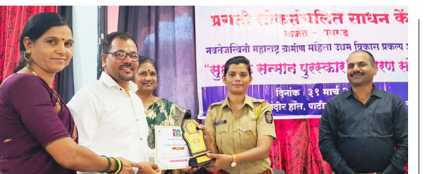
सुधारक सन्मान पुरस्काराचे वितरण

पाली : राबगाव येथील वरदायनी देवीची यात्रा चैत्र शुद्ध पौर्णिमेच्या दिवशी मोठ्या उत्साहात व जल्लोषपूर्ण वातावरणात पार पडली. दुपारी ४ वाजल्यापासून या यात्रेला सुरुवात झाली. यावेळी या यात्रेचे मुख्य आकर्षण म्हणजे राबगाव व गावांच्या असलेल्या चार वाड्यांमध्ये महादेवाच्या काठ्या नाचवत आणल्या जातात. ढोळ-ताशे व डिजेच्या तालावर या रंगीरंगी सजवलेल्या काठ्या तरुणाई तसेच काही जेष्ठ मंडळीदेखील मोठ्या हौसेने नाचवतात. या एक दिवसाच्या यात्रेमध्ये आजूबाजूच्या परिसरातील हजारो भाविक आपली उपस्थिती दाखवितात. यात्रेमध्ये मिठाईची दुकाने, लहान मुलांची खेळणी असलेली दुकाने, विविध खाद्याचे स्टॉल लागलेले असतात. यातून सर्व व्यावसायिकांची लाखो रुपयांची उलाढाल होते. यात्रा संपल्यानंतर वरदायनी देवीची पालखी मंदिरातून हरीनामाच्या जयघोषात निघून संपूर्ण गावात फिरते. या यात्रेत उंबरवाडी, आदिवासीवाडी, नंबरवाडी, गावडेवाडी, जांभळमाळ आदि वाडीतील लोकांचा मोठ्या प्रमाणात सहभाग असतो.