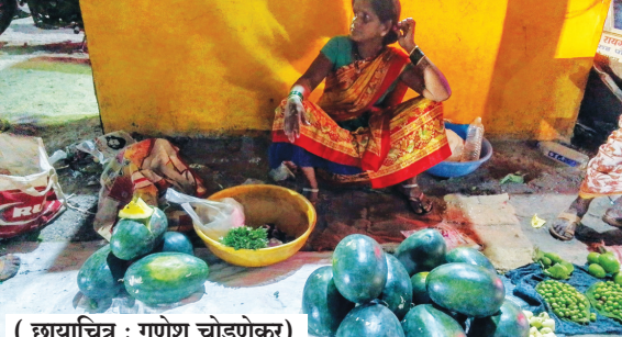
डायबिटीस असलेल्या लोकांसाठी उत्तम आहेत. सध्या बाजारात

उन्हाळा सुरू झाल्यावर रसाळ कलिंगडांना मागणी वाढते. कलिंगड म्हटलं की डोळ्यासमोर लाल गर असलेले फळ दिसते. मात्र, मुरुडच्या बाजारात आता पिवळा गर असलेला कलिंगड दाखल झाले आहेत. ही कलिंगडे मुरुड-शिर्णे येथील परागान गावातील असून ती नागरिकांचे लक्ष वेधून घेत आहेत. ही कलिंगडे चवीला गोड व आरोग्याला पोषक तसेच